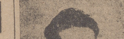
TORQUEMADA.—Estamos muy animados y espero que hagamos un gran papel en Mestalla.

TAPIA.—En este partido el Valladolid conseguirá el empate.