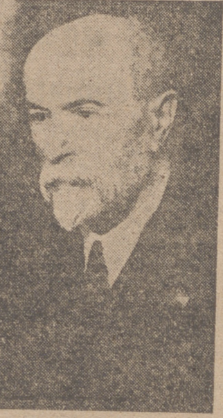
Thomas Masaryk, fundador y primer presidente de la República checoslovaca

Los checos se sentían orgullosos de poseer una Constitución tan democrática o más que la de Estados Unidos. Ahora soportan el totalitarismo en mayor grado que cuando Hitler dominaba el país