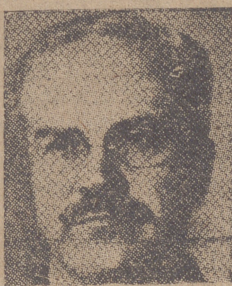
MOLOTOV. Uno de los catorce hombres que se reparten el dominio absoluto sobre la quinta parte del mundo.

—No; la guerra, mientras dependa de la U. R. S. S., no la habrá... por ahora. La Unión Soviética celebrará la guerra un día, pero no hoy, ni mañana. En todo caso, ni en 1947 ni en 1948. Probablemente se levantó y marchó lentamente a través de la habitación, cuyos muros estaban tapizados de libros y ficheros.