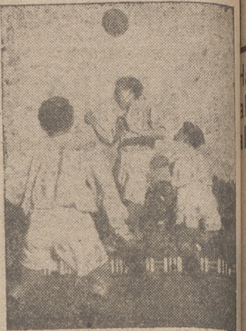
La delantera del Valladolid, más codiciosa que otras tardes, buscó con gran coraje la golcada.