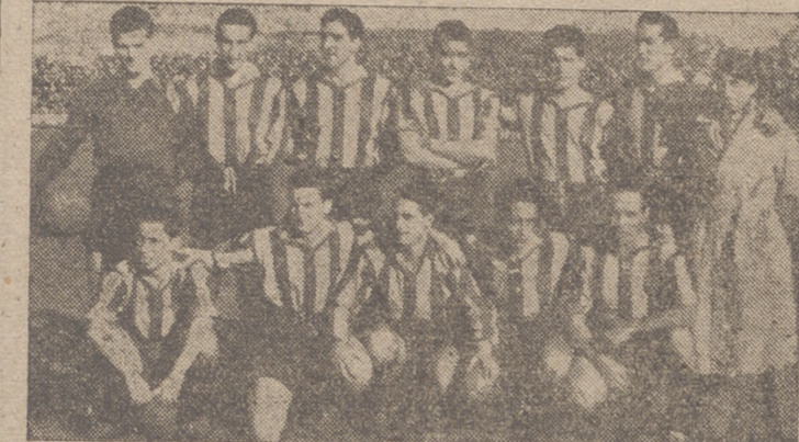
El Baracaldo, que fué derrotado por 4-1 frente al Real Valladolid.

Vimos el domingo un auténtico partido de campeonato. Desde el primer momento los dos equipos se emplearon a fondo en busca de un desenlace favorable, porque el partido era trascendental para ambos contendientes. El Valladolid se jugaba un gran tanto por ciento de sus posibilidades de ascenso, y los de Baracaldo una de las últimas coyunturas de salvación. La consecuencia fué un duelo