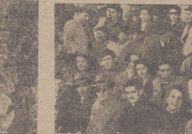
El público de tribuna espera con optimismo el resultado del segundo tiempo