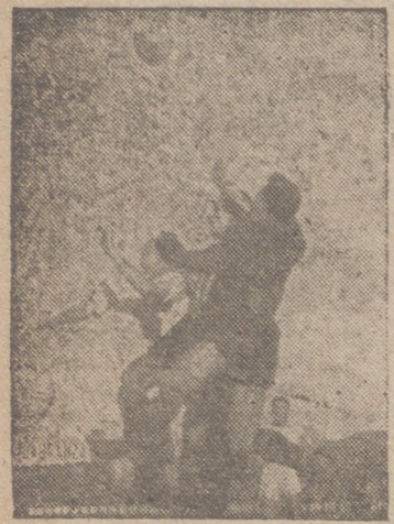
Coque y Vaquero van al remate de una pelota y Mezo espera también el balón.

Justa victoria de los locales en premio a su entusiasmo