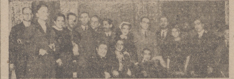
El Cuadro Artístico que el domingo actuó en Calderón, en el Concurso que ha organizado Educación Popular