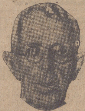
el gobernador de Minesota (Estados Unidos), Younghal, y su esposa.

A la ceremonia asistieron todos los diputados, el Gobierno en pleno, el Cuerpo diplomático y numerosas personalidades. Entre los extranjeros figuraba