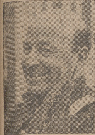
El «Bombero Torero».

El espectáculo "GALAS DE ARTE" se repetirá el sábado