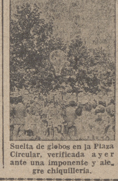
Suelta de globos en la Plaza Circular, verificada ayer ante una imponente y alegre chiquillería.