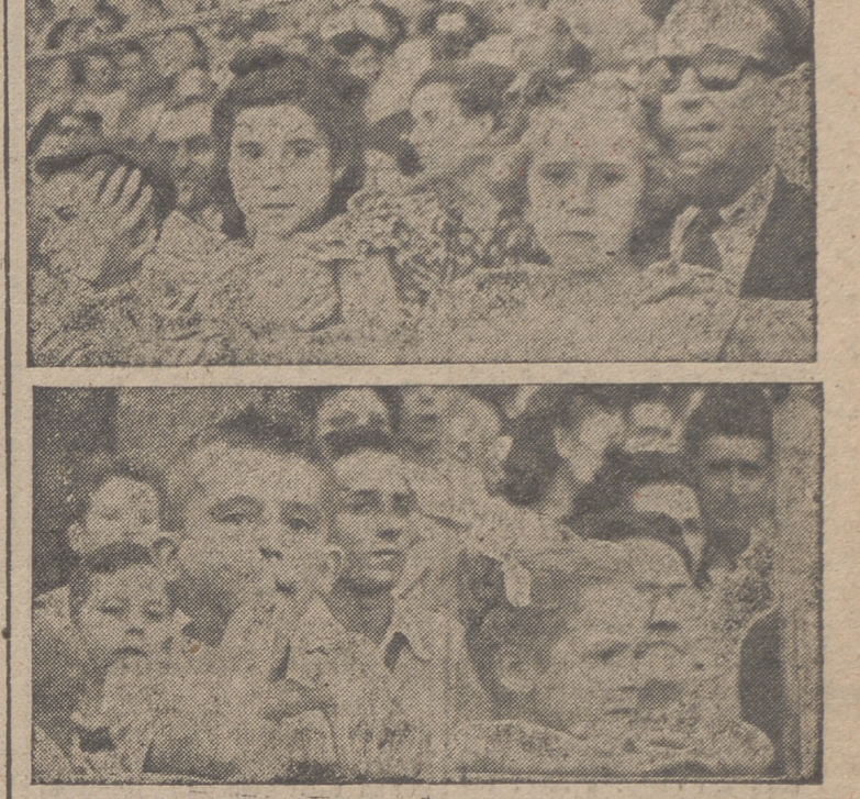
HACIA LA ESTRATÓSFERA