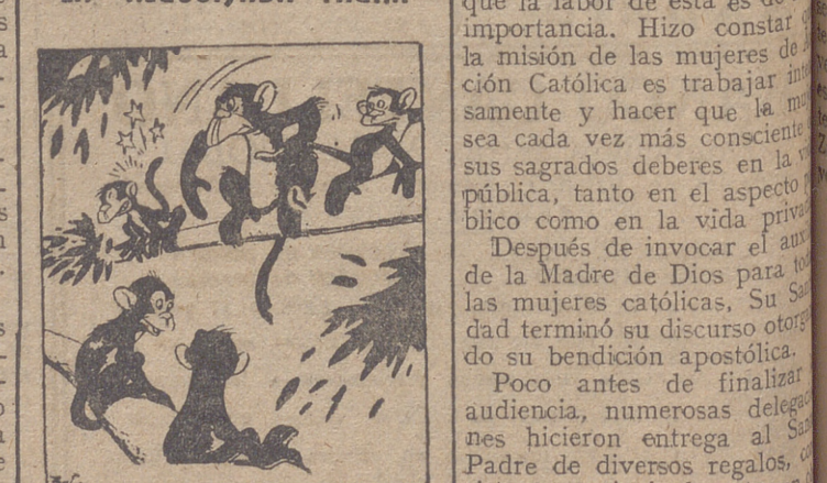
—Esta mona parece casi humana. Trata a su pequeño como una verdadera mamá de esas.

Vertical text on the right edge of the page, partially cut off.