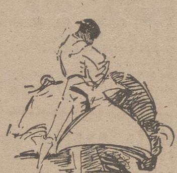
Si admitimos esa convencional distinción entre lo que se denomina "escuela sevillana" y lo que se conoce con el nombre de "escuela rondeña" bien pudieramos llegar a la siguiente proposición: la escuela sevillana es al canto por bulerías, lo que la rondeña es al canto por siguiriyas. Allí, la alegría, la agilidad efervescente, la chufía y el donaire. Aquí, el sentimiento, la hondura, la reposada gravedad en el alma de una raza apasionada. Aquello, el canto bullicioso para un rato de chusmeta. Esto, lo que un hombre se dice a sí mismo, para desahogarse a solas.