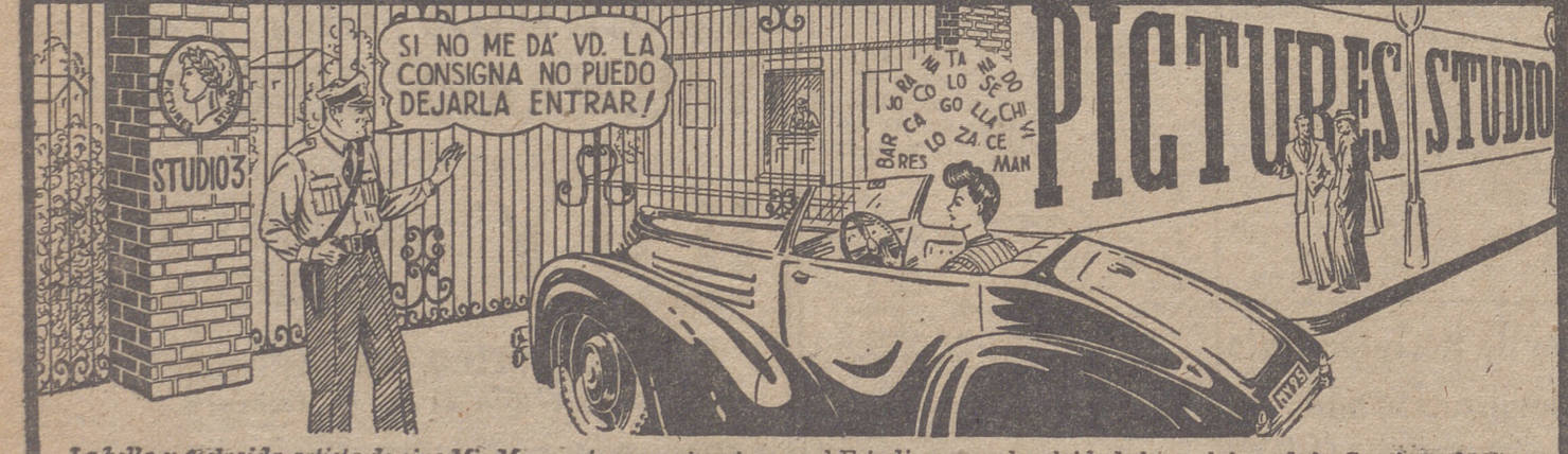
La bella y distraída artista de cine Mis Margaret, no puede entrar en el Estudio porque ha olvidado las palabras de la Consigna del día. Las sabe, pero se le mezclan en la cabeza y no puede llegar a coordinarlas....

En Rusia, de donde regresó a Alemania inmediatamente después de terminarse la guerra.—Efe.