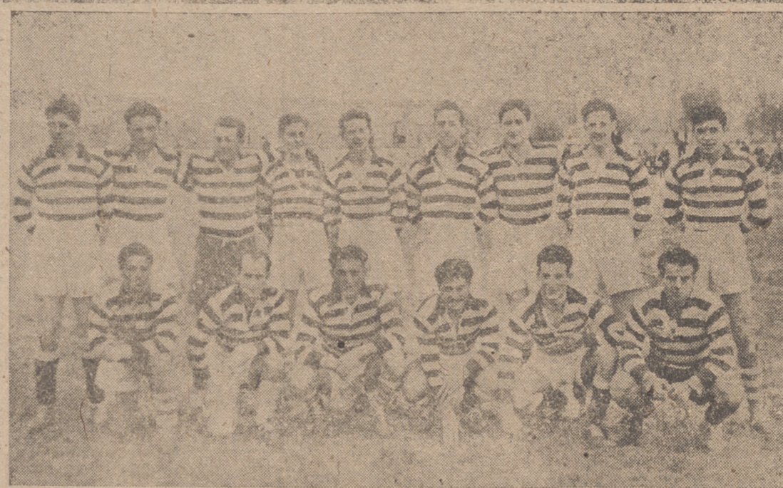
Equipo del D. S. de Valladolid, campeón de sector al vencer a Oviedo por 12-0.

Almacén de Paños Sucesores de FEDERICO TEJEDOR General Mola, 3 Ped. Anuncio