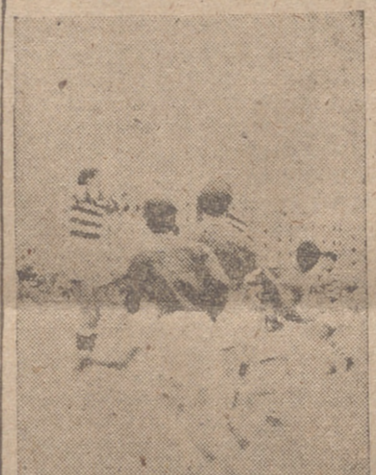
Una jugada personal de Rojo, que valió un ensayo al equipo de Valladolid.

En el segundo salió a asegurarse el partido y lo consi-