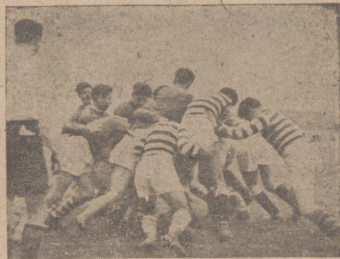
UNA MELE DEL PARTIDO DE RUGBY.