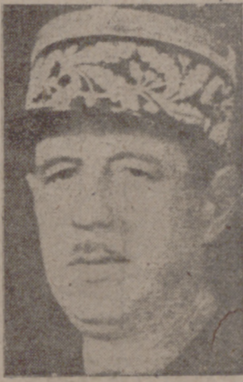
General de la Confederación General del Trabajo. (Pasa a la cuarta página.)

Paris, 16.—El general De Gaulle adoptó esta mañana la decisión de renunciar a la formación de Gabinete y de informar a la Asamblea constituyente de su resignación como jefe del Gobierno, cargo para el que fue elegido por unanimidad el pasado martes. Tal decisión es consecuencia de las diferencias del general con los dirigentes comunistas en cuanto se refiere a las carteras que han de atribuirse en el Gobierno de coalición al partido comunista.