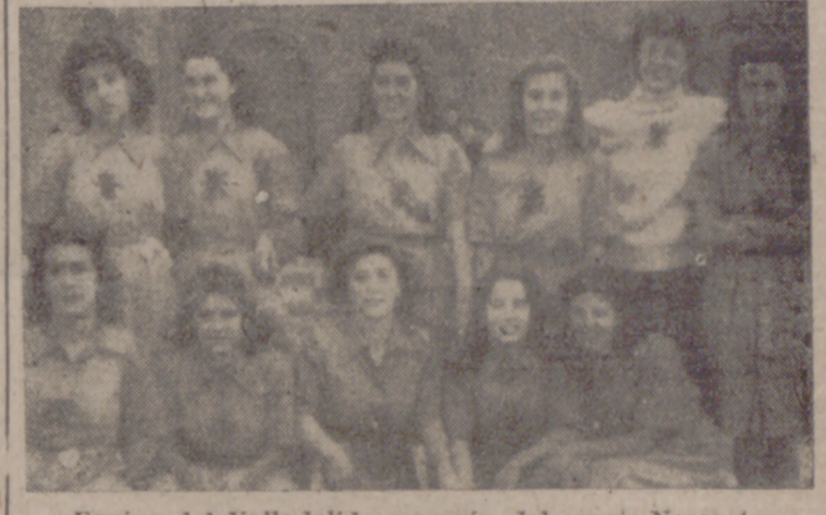
Equipo del Valladolid, campeón del grupo Noroeste.

El pasado lunes, en el Estadio de Balaidos, el equipo de la Sección Femenina vallisoletana, contendió con su homónimo vigués. Para Valladolid era de vital importancia el ganar este partido, que se presentaba difícil, pues no solamente era el terreno contrario, escenario de esta lucha, el factor desfavorable para conseguir la victoria, sino también el fuerte conjunto gallego que alineaba a sus mejores jugadoras, las cuales decididamente esperaban sacarse la espina de partidos anteriores, en los que la suerte las fué adversa y que indudablemente querían demostrar ante sus paisanos la valía de su equipo apuntándose una victoria.