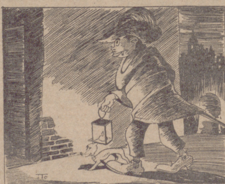
Precioso y práctico traje de noche.