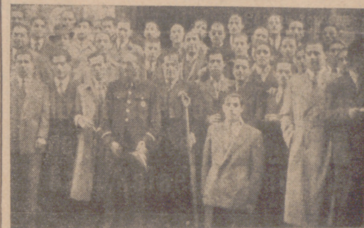
Un grupo de asistentes a la misa.

Con motivo de celebrarse ayer la festividad del Arcángel San Rafael, la Comisión Inspector del Benemérito Cuerpo de Mutilados por la Patria celebró una misa en la iglesia parroquial de San Miguel en honor de su excelso Patrón.