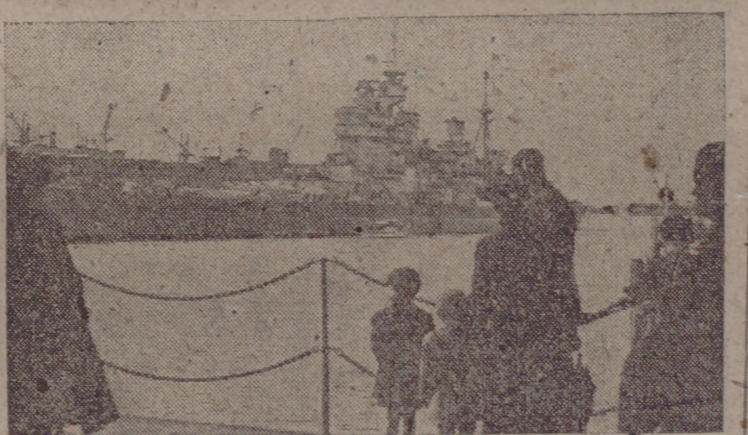
Una vista del acorazado inglés «Howe», buque insignia de la Escuadra inglesa del Pacífico, durante una visita que hizo a Suakland (Nueva Zelanda).