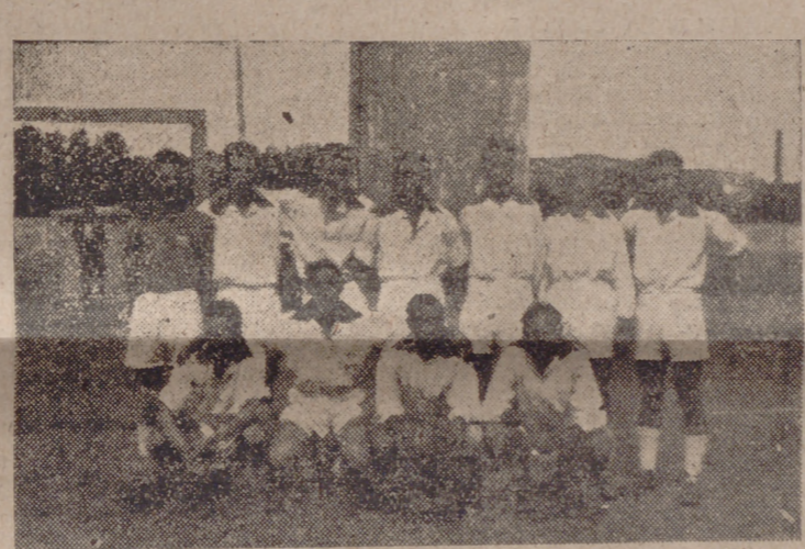
EQUIPO DEL ATLETICO J. A. C.

Continuando los partidos de la "Copa Real Valladolid Deportiva", en la tarde de ayer se enfrentaron el Atlético J. A. C. y Deportivo J. O. C. venciendo los primeros por 6-0.