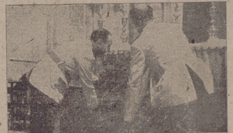
El ministro secretario general del Movimiento, camarada Arrese, coloca la corona de laurel al pie de la cruz del monumento a los caídos alaveses.