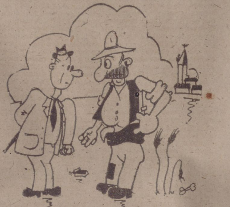
Por CHUCHU. —¿Y usted dice que sab e mucho del campo? —Tenga en cuenta que me dieron sobresaliente e trigo-nomecristas.

—Desde luego, y es útil... (Pasa a la tercera página)