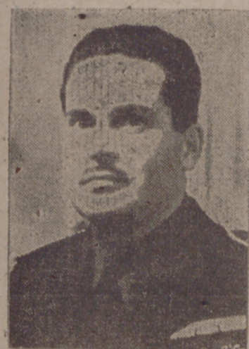
El gobernador civil y jefe provincial del Movimiento de Segovia, camarada José Clavero, ponente regional de "Problemas madereros y resineros", en cuya defensa y desarrollo demostró su gran competencia y acertada visión del tema.