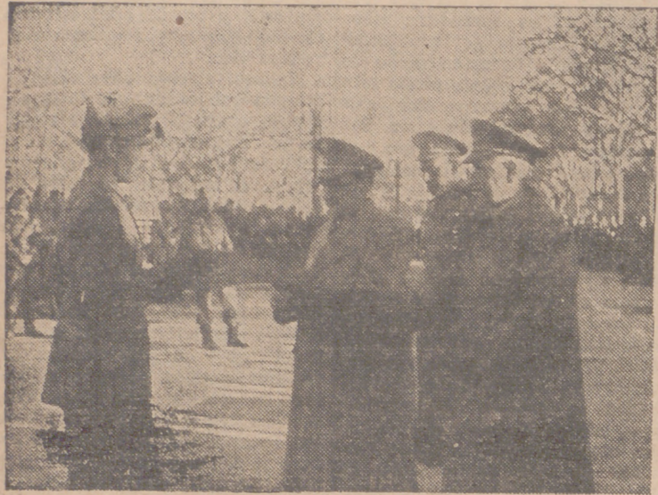
El general Palenzuela entrega el diploma de campeón regional al oficial que mandaba la unidad y que entró en primer lugar

Infantería Milán núm. 3, de Oviedo, subcampeón regional