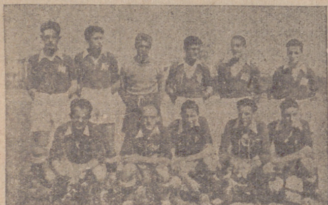
Actual equipo del simpático y entusiasta Aguilas F. J.

delegado técnico de los equipos del Frente de Juventudes, nos habla del DEPORTIVO AGUILAS