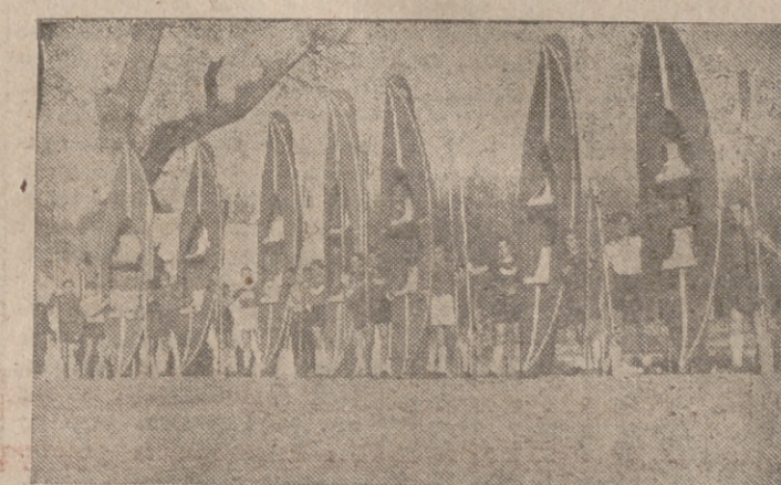
Los cursillistas universitarios se disponen a iniciar sus ejercicios prácticos.

Para dar a nuestros lectores una amplia información en SABADO DEPORTIVO de los fines que persigue este primer cursillo y una idea de lo que es este deporte, he convidado durante unas horas con estos camaradas en el