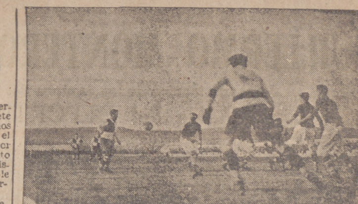
Un partido Luises-Español. En el centro, Germán con sus clásicos y múltiples pañuelos.

—Ese muchacho juega muy bien, pero en este partido está haciendo un juego muy individual. —Es que hoy no valen los "pases". (CHUCHI)