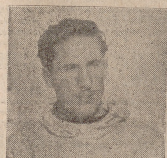
Desde el día 4 del presente mes viene desarrollando en nuestra ciudad, los camaradas instructores

Ha dirigido el primer cursillo de instructores de Remo del S. E. U., que se clausura hoy