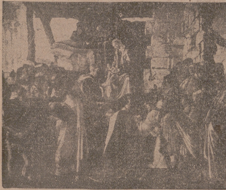
«LA NAVIDAD», DE BOTTICELLI

Sopa de almendras. Besugo cocido de Nochebuena. Capon relleno. Turrones y mazapán. Nueces, almendras, avellanas, castañas, pasas. Frutas. Vino, café y licores.