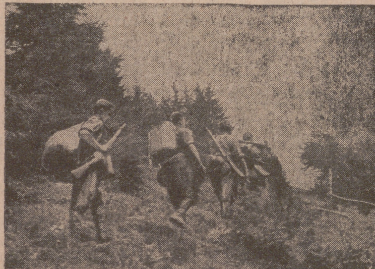
Soldados alemanes cargados de víveres y municiones, llevándolos a sus camaradas que se encuentran en las cumbres.