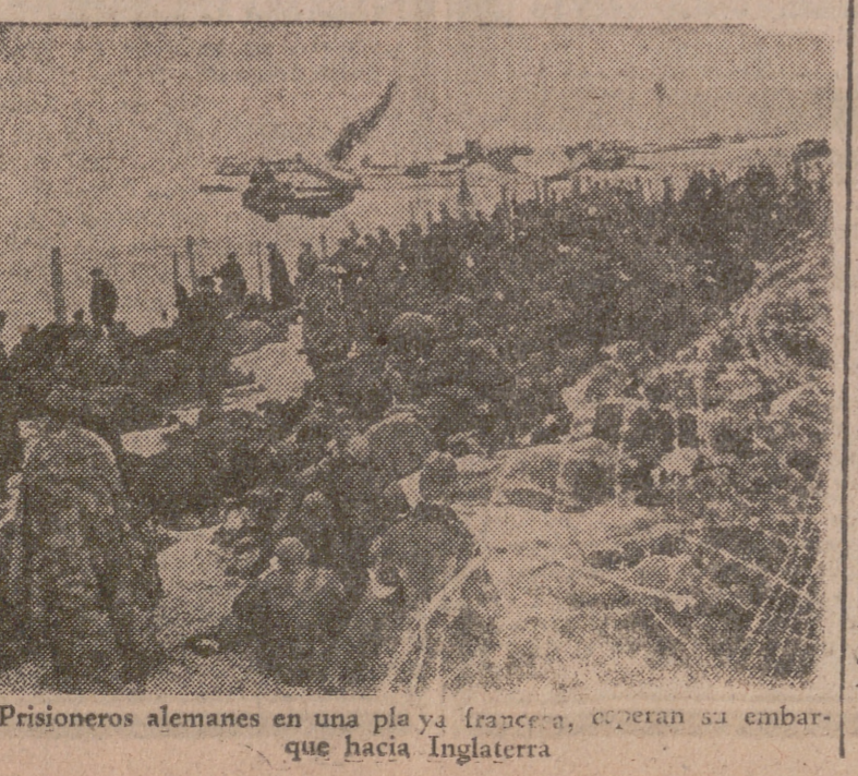
Prisioneros alemanes en una plaza francesa, esperan su embarque que hacia Inglaterra.

De Valera anuncia una declaración sobre acogida de responsables de la guerra Londres, 11.—En relación con la contestación irlandesa a la petición de las naciones aliadas sobre acogida a «criminales de guerra», los censores competentes de Londres aclaran que el primer ministro de Irlanda, De Valera, informó el día 3 de octubre al Parlamento que esperaba tener una declaración sobre particular al cabo de un par de semanas.—Efe.