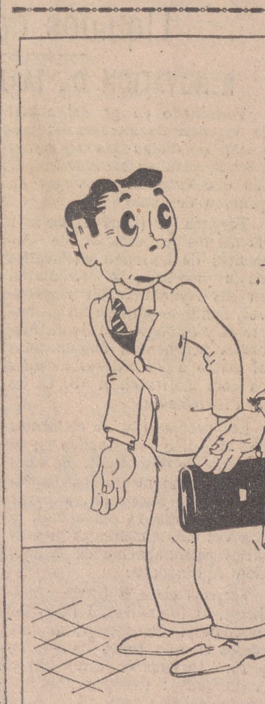
«TOROS» EL DIA DE SAN PEDRO, (por ITO) —No hay clases el día de San Pedro, pero aunque lo hubiera yo me iba a la corrida. —Y yo, que también soy aficionado a los «toros».

Por lo que se refiere a la postura británica frente a estos problemas, puede decirse que no está aún fijado con carácter definitivo y que resultaría temerario asegurar que el Gobierno inglés