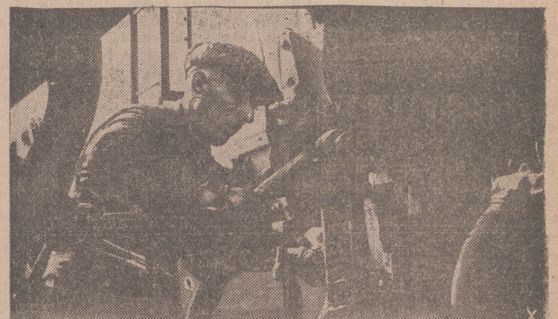
La industria alemana de guerra aumenta en continua producción. En ella, miles de trabajadores colaboran en el esfuerzo para ganar la victoria.