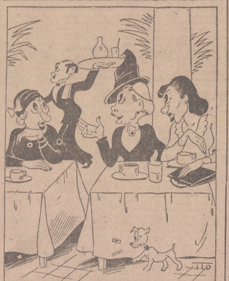
LAS QUE ALTERNAN.—Por ITO —Nosotras no faltamos a ningún espectáculo, pero sobre todo a los que más se anuncian... —Vamos, sí, ¡que ustedes no se pierden ni el de la invasión!

El monumento está coronado por un águila muerta