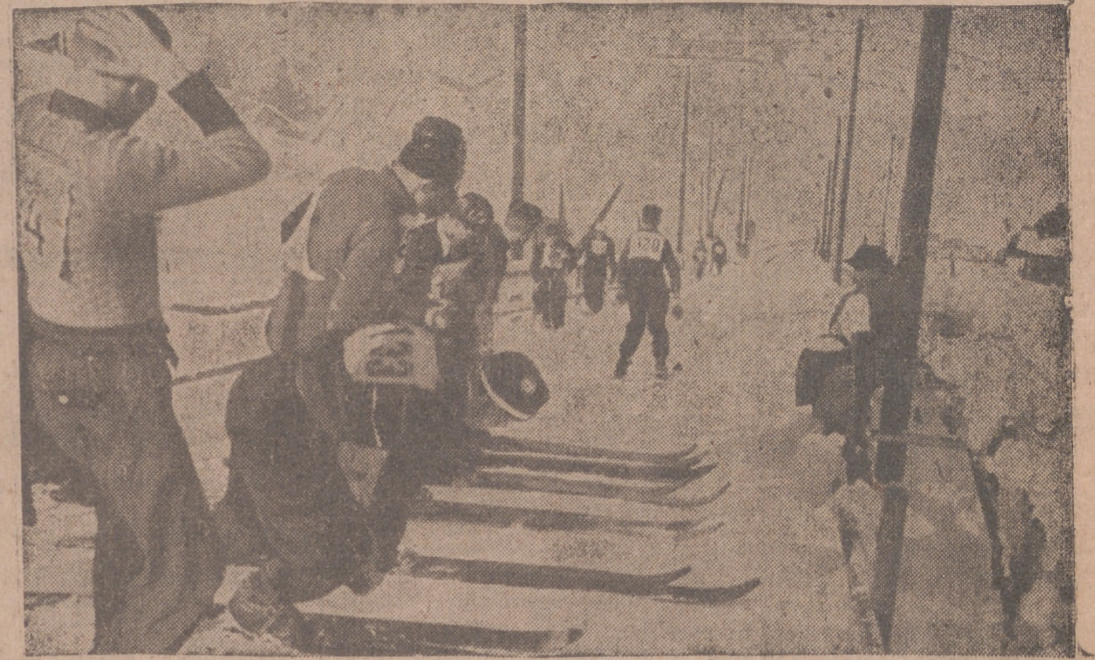
Momento de tomar la salida hacia el trampolín de los saltos uno de los participantes. — (Orbis-Foto).