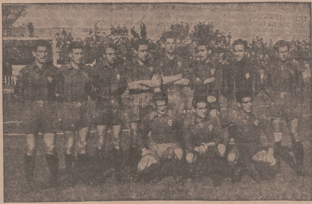
El Murcia, que causó una excelente impresión el domingo en el campo del Paseo de Zorrilla.

La catástrofe del domingo es el justo remate a la campaña desastrosa reanuda por el Valladolid durante la presente temporada, porque los que hemos seguido de cerca toda la serie de vicisitudes pasadas por el Valladolid en la presente temporada, hemos de reconocer que pocas o casi ninguna han sido las cosas que se han hecho a derechas, y como consecuencia, muy pocas también han sido las que han salido bien, pero no es esta la ocasión de enjuiciar actitudes y gestiones, sino de ver cómo después de una funesta actuación del equipo durante la presente temporada, cuando las cosas parecían haber iniciado el camino del resurgimiento moral y técnico del equipo, nos encontramos con que tenemos que sufrir la más trascendental de las derrotas y con ella la casi segura derrota del descenso automático.