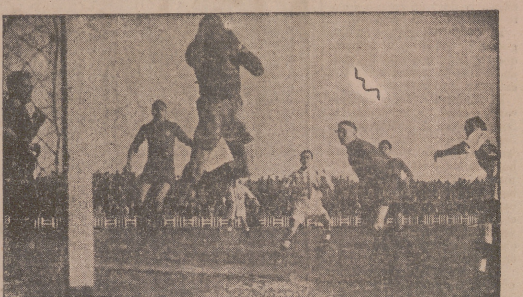
Cavido ha rematado de cabeza un saque de esquina y Marín bloquea con gran seguridad.