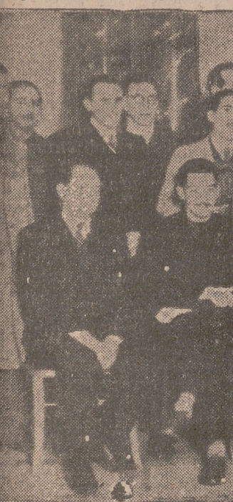
El jefe provincial y gobernador civil, con otras jerarquías, con los periodistas vallisoletanos, durante la proclamación y toma de posesión de la Junta Directiva de la Asociación de la Prensa, celebrada el domingo.

pronunció elocuentes palabras, destacando la misión de las Asociaciones y solicitando de la Junta Directiva que tomaba posesión y de los periodistas en general una labor falangista y en pro de los intereses de España, en los que la Prensa desempeña un papel primordial, y concluyó deseando a la nueva Asociación una vida próspera llena de éxitos.