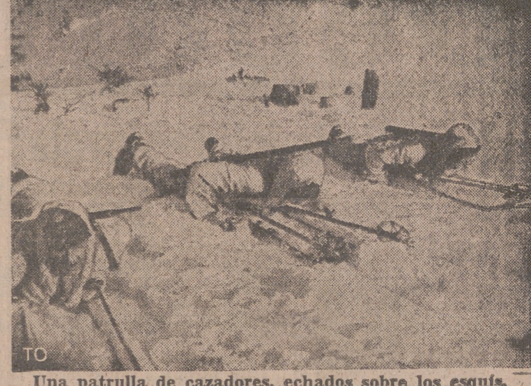
Una patrulla de cazadores, echados sobre los esquís, se acercan a las posiciones enemigas.