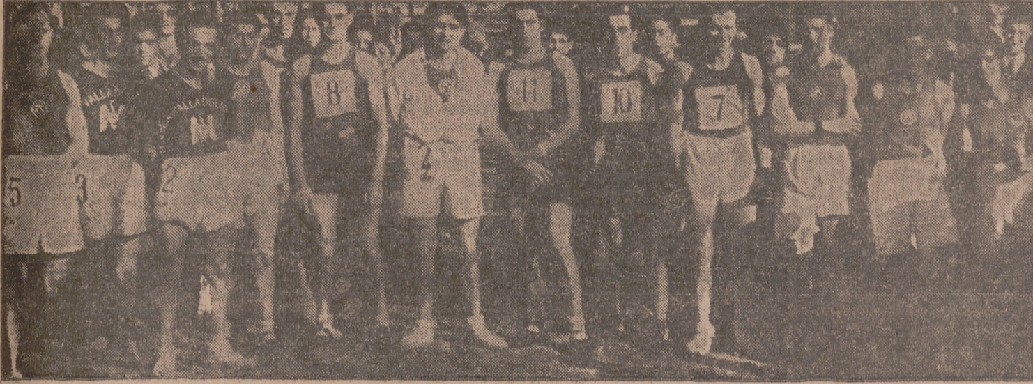
PARTICIPANTES EN LA PRUEBA DE CAMPO A TRAVES