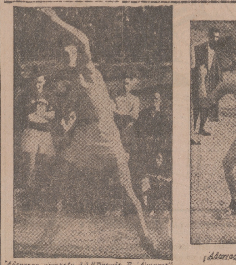
Adarraga campeón del "Premio F. Almagro"

La caza aliada realizó numerosas patrullas ofensivas sobre la cabeza de puente y desarticularon numerosos ataques aéreos adversarios.