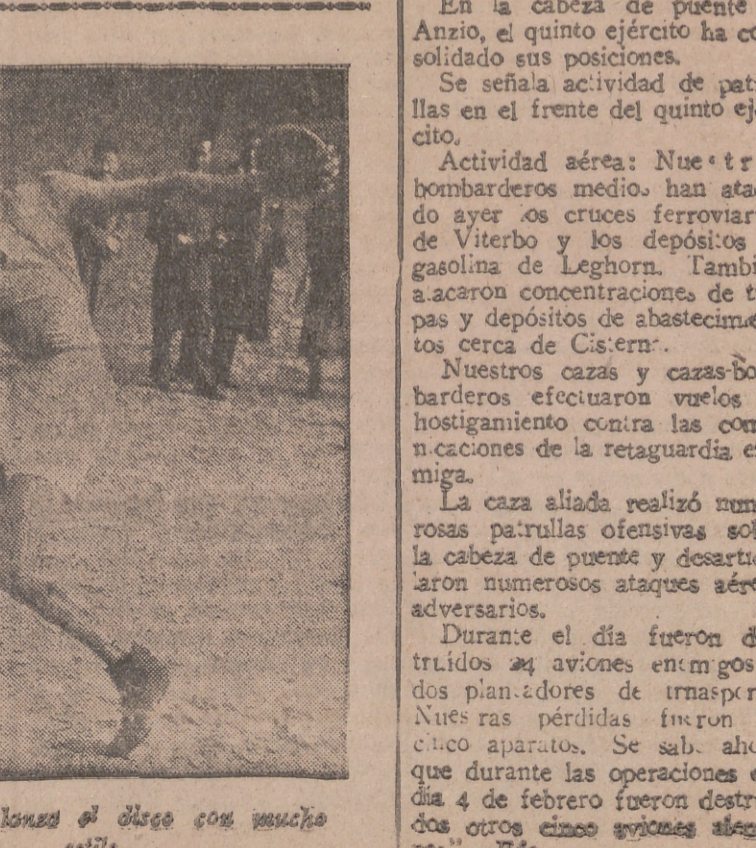
Adarraga campeón del "Premio F. Almagro"