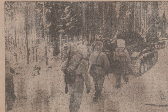
Infantería finlandesa avanzando protegida por los tanques