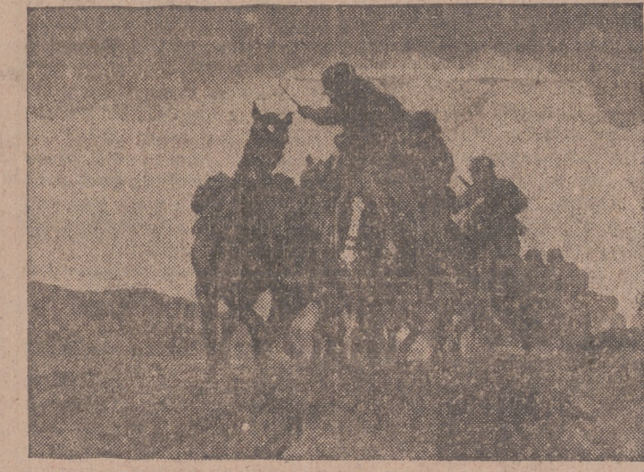
«Avance», óleo de Alfred Roloff, de Berlín.