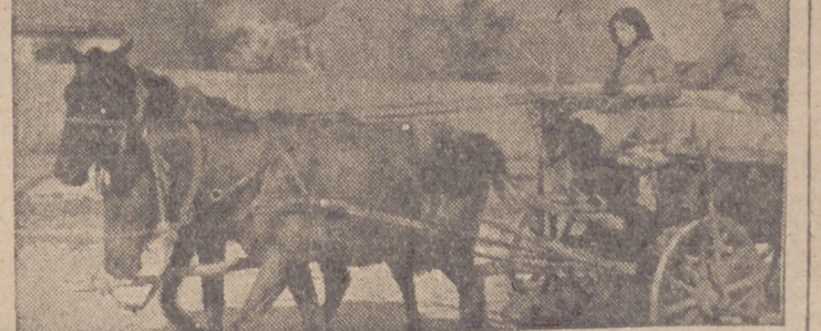
Campesinos de un pueblo ruso ocupado por las tropas alemanas, que con el fin de no volver a caer en manos bolcheviques se retiran con sus enseres más a retaguardia

Londres, 9.—Un nuevo tipo de avión alemán se encontraba entre los tres aparatos que fueron destruidos en la noche última sobre Inglaterra. Se trata de un "Messerschmitt 140", caza-bombardero bimotor. Sir Archibald Sinclair, secretario del Aire, declaró recientemente que este aparato era parecido al avión británico "Mosquito".—Efe.