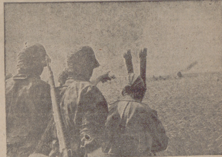
El jefe de una compañía de Infantería alemana vigila los movimientos de los bolcheviques