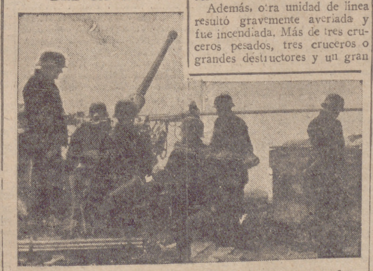
Potentes cañones antiaéreos alemanes se oponen, formando parte de las grandiosas defensas del Canal de la Mancha, al paso de los aviones enemigos en sus ataques a Europa.