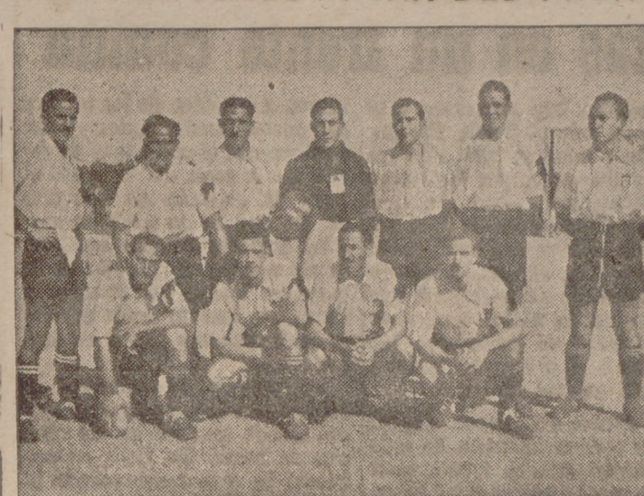
Equipo del Pisuerga-Cultural, que el domingo venció ampliamente al Pilarica.

El local donde se efectúe se dará a conocer dentro de unos días y que no dudamos será de la competencia de los numerosos aficionados.