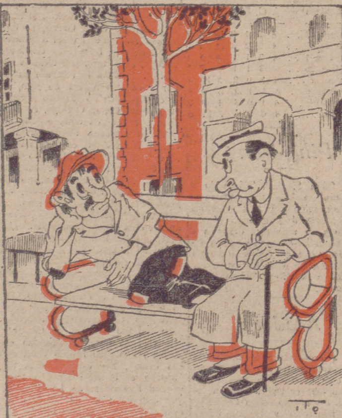
EN LA PLAZA, por ITO —A ver si se está quieto; ¡no hace usted más que dar cambios y vueltas...! —Es natural; ¡como que estamos en un banco!

PRODUCTORES ASALARIADOS Toda testón corporativa que se frais con ocasión o por consecuencia del trabajo que ejecuten por cuenta de su propio empresario, o de derecho a indemnización, bien temporal, ya permanente, en el caso de la Exposición nuestro caso en la Caja de Seguro de Accidentes del Trabajo en la Delegación de Valladolid, Alarcón, 2.