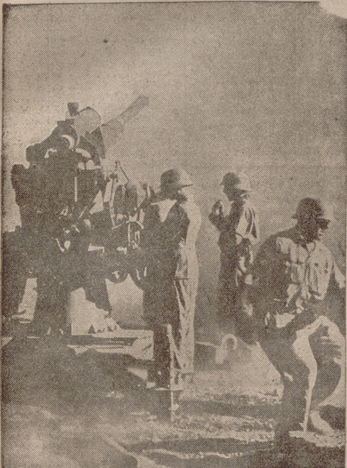
Artillería antiaérea alemana en acción