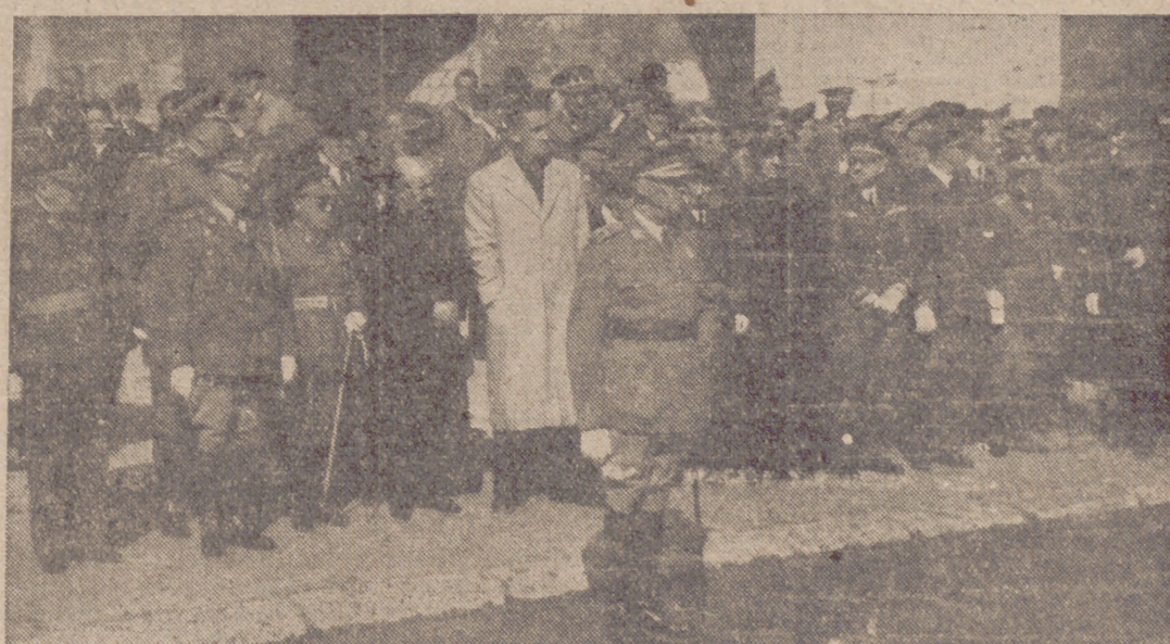
El Excmo. señor capitán general y autoridades, presenciando el desfile de las fuerzas de Intendencia después de la misa celebrada en San Benito.