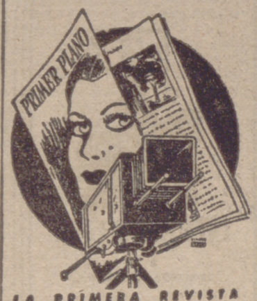
LA PRIMERA REVISTA ESPAÑOLA DE CINE ES PRIMER PLANO