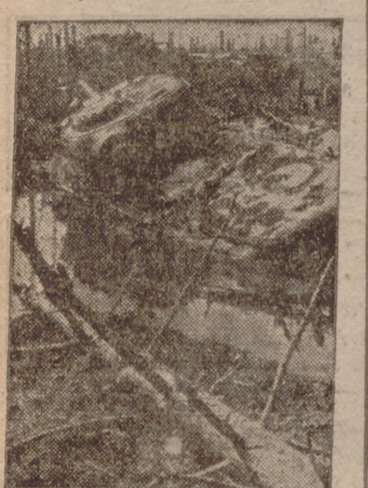
He aquí el estado en que quedó un tanque ruso después de la batalla