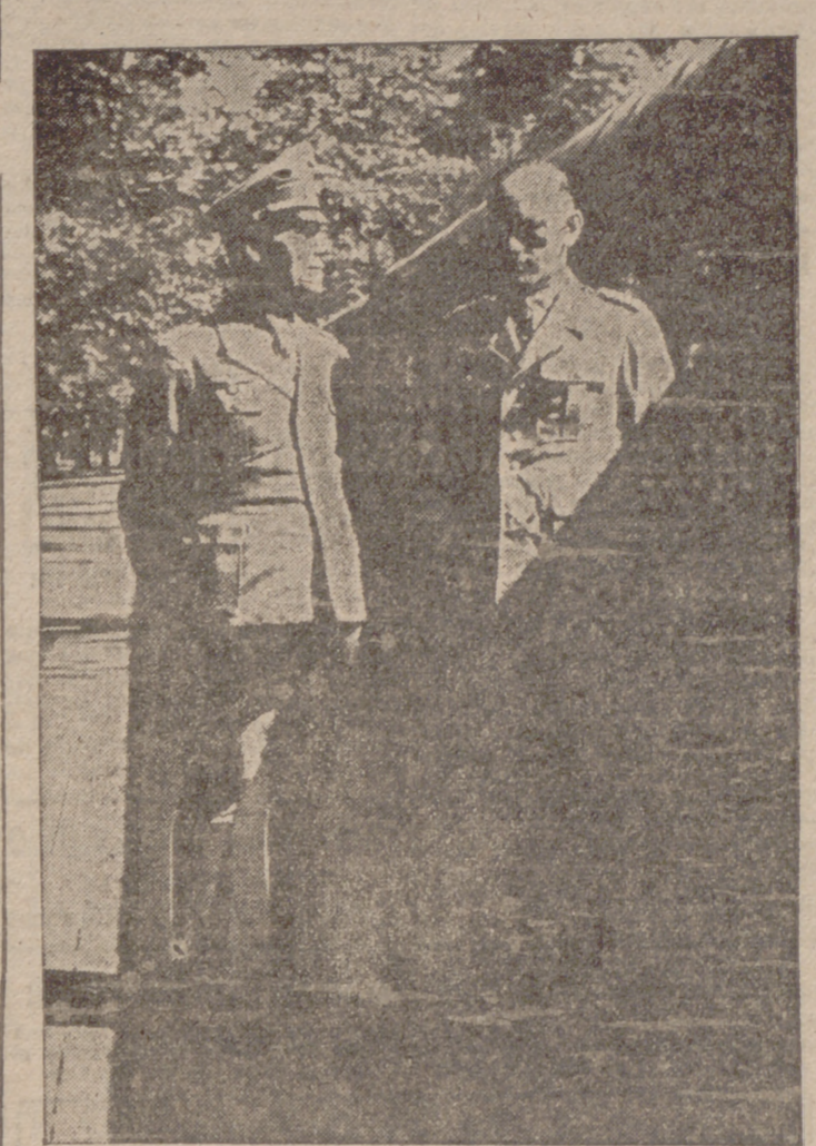
El mariscal de campo Rommel, ahora jefe de las fuerzas alemanas del Norte de Italia

La producción norteamericana de aviones alcanzará en 1944 la cifra de 120.000