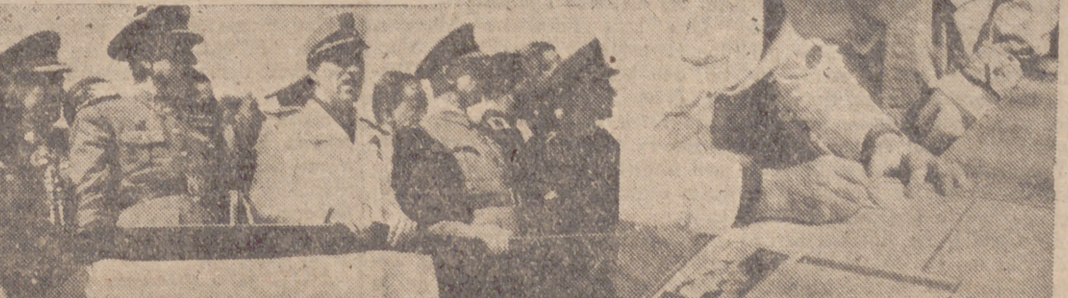
(LEA AMPLIA INFORMACION EN ULTIMA PAGINA)

El jefe nacional del S. E. U. presenció el acto con las demás jerarquías y firmando en uno de los carteles murales del Campamento