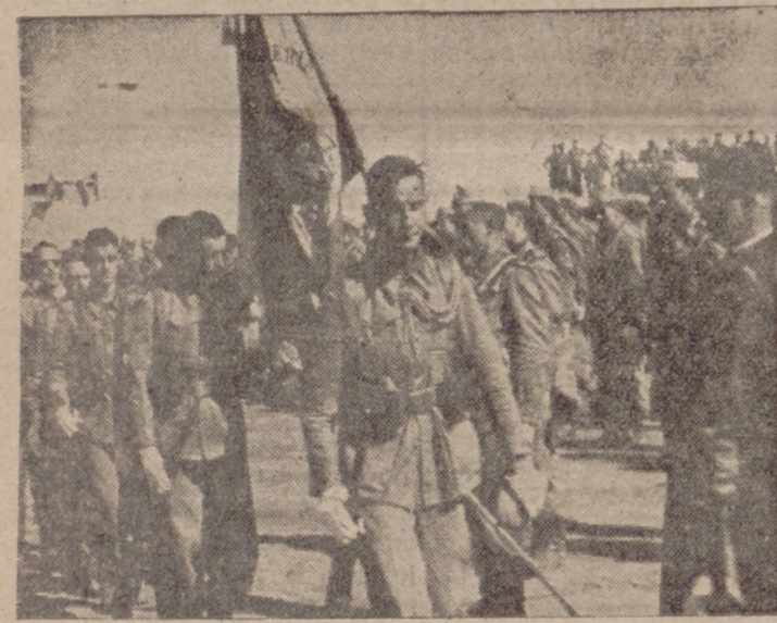
Otro instante del solemne acto de la Jura