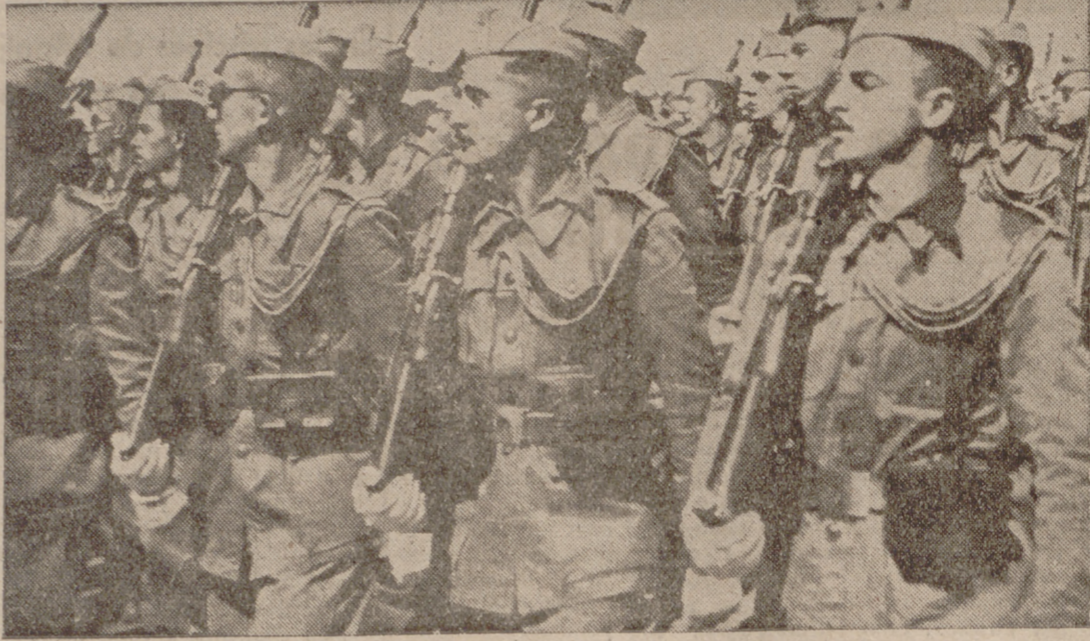
DOS MOMENTOS DEL VISTOSO DESFILE DE LOS CABALLEROS ALUMNOS