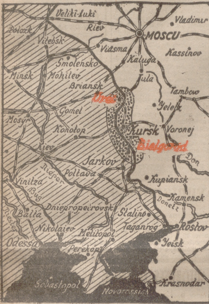
TEATRO DE LA BATALLA DE BELGOROD-OREL

400 carros, 193 aviones enemigos y grandes cantidades de material destruidos