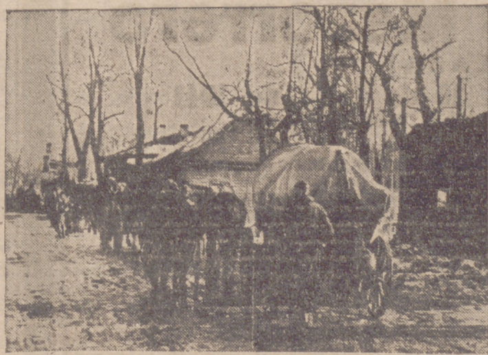
El mal tiempo y lluvia ha llenado el camino de charcos y barro. Pero no por eso se interrumpe el paso de tropas alemanas que se dirigen al frente.