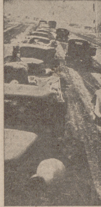
He aquí una columna de camiones alemanes que abastecen el frente de viveres y de municiones.