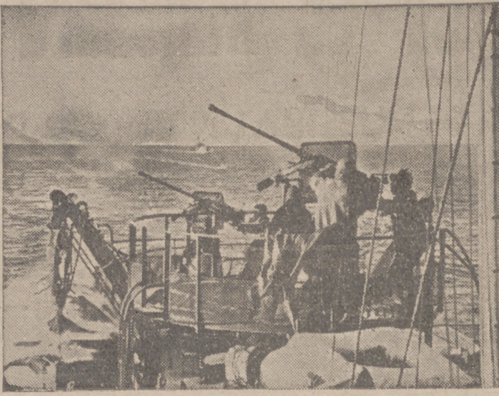
Se sonó la señal de alarma en la costa noruega. Momentos después se hallan las baterías antiaéreas en actividad y los aviones enemigos inician la retirada.