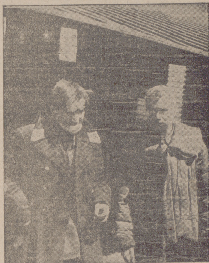
He aquí dos aviadores soviéticos capturados en el frente del Este al ser derribados con su aparato por los certeros disparos de las baterías antiaéreas rumanas.