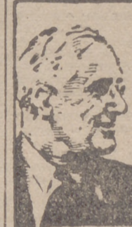
Washington, 26.—Por 244 votos ha sido rechazado el veto presidencial al proyecto de ley antihuelgas. Dichos votos se descomponen de la siguiente forma: 114 de los demócratas y 130 de los republicanos.

“Es la primera vez—comenta la Agencia Reuter—, desde que ocupa el Poder, que Roosevelt sufre una gran derrota.”—Efe.