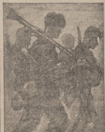
Gran Cuartel General del Führer, 26.—El Alto Mando de las fuerzas armadas alemanas comunica: