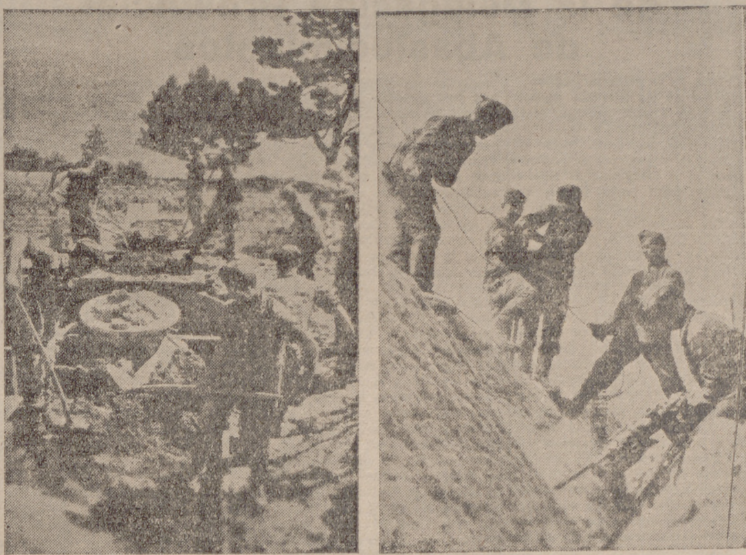
He aquí dos aspectos de la construcción de fortines en la costa del Mediterráneo por las tropas alemanas. En la de la izquierda vemos los trabajos para la construcción de un fortín, y en la de la derecha, colocando alambradas de protección.