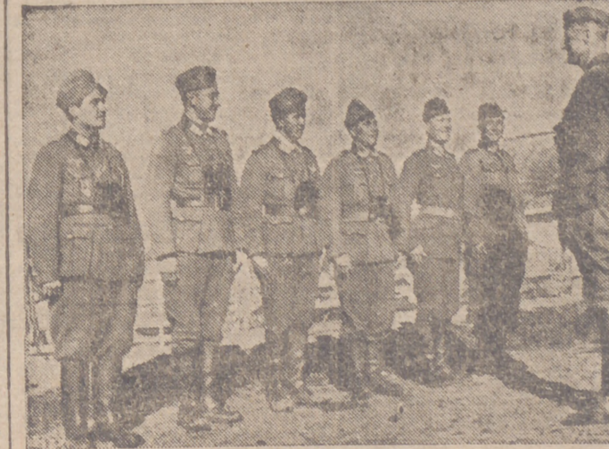
El comandante de un batallón de fuerzas nacionales del país, dando órdenes para las próximas maniobras a realizar.