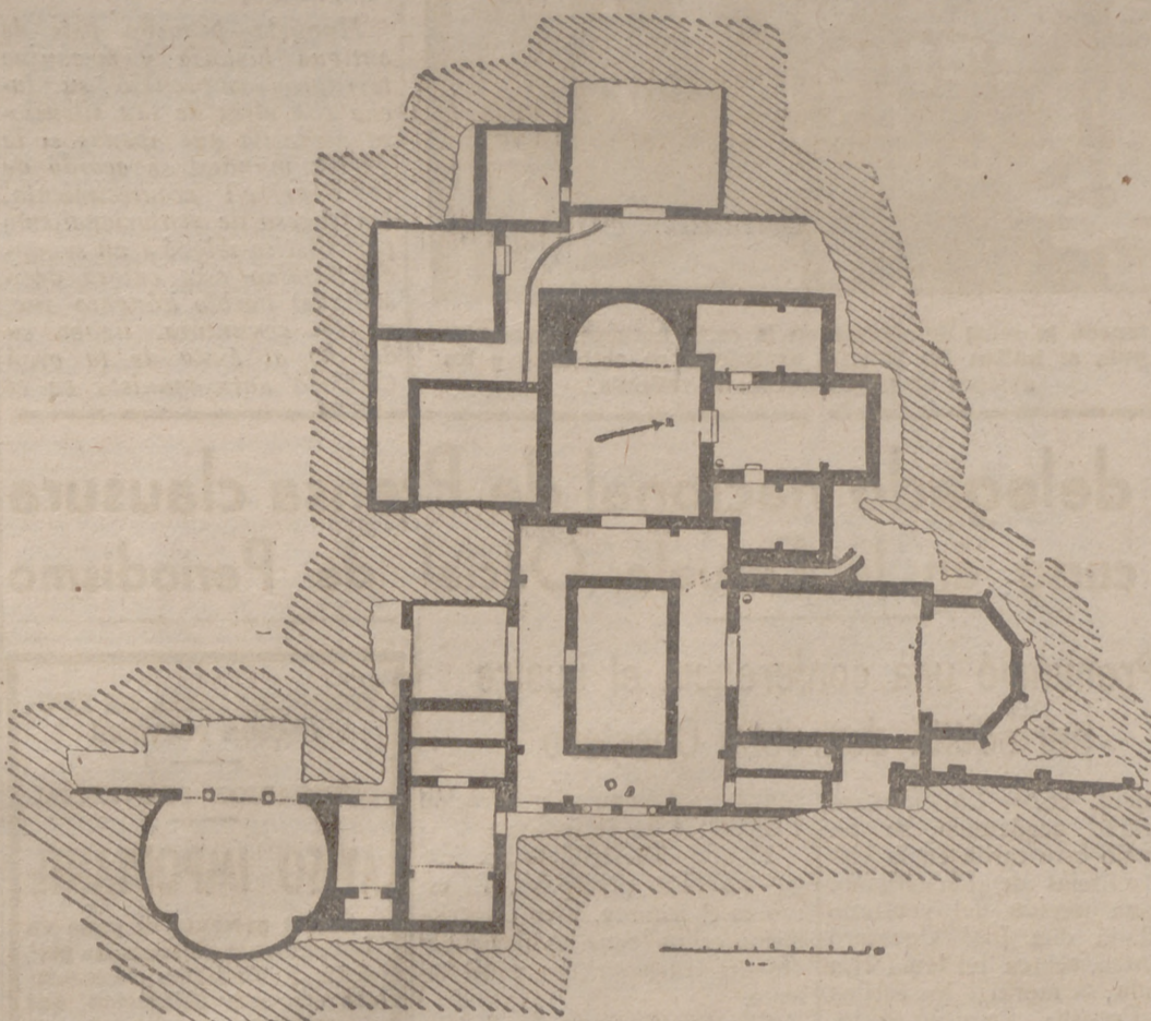
Plano general de las excavaciones—el primero obtenido por la Universidad—que ha sido cedido para su publicación en LIBERTAD, y que muestra la importancia de las excavaciones que se realizan en Almenara.