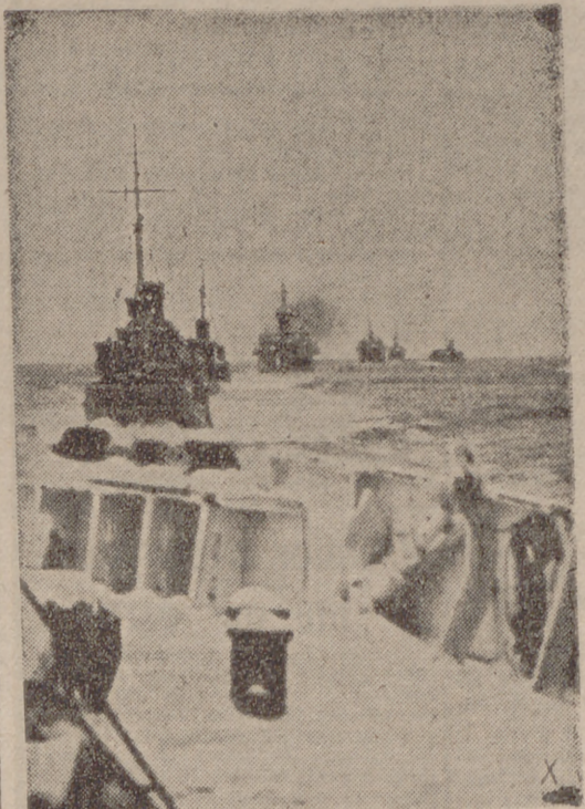
Fuerzas armadas de la Marina de guerra alemana protegen el convoy contra ataques enemigos.