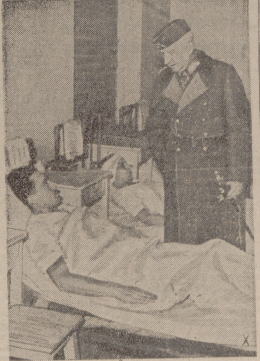
Los heridos alemanes son constantemente visitados por jerarquías del Ejército, que celosamente se interesan por su estado.