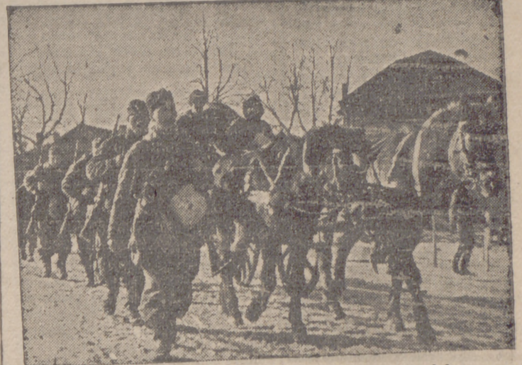
Los soldados alemanes avanzan hacia sus nuevas posiciones en el frente del Este.