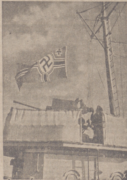
Arriando la bandera en un guardacostas de la Marina de guerra alemana.