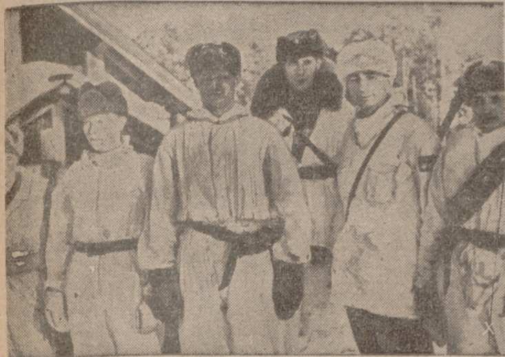
Soldados rusos voluntarios que combaten al lado de Alemania en contra del comunismo.