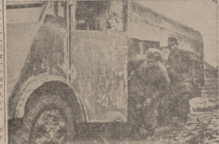
Durante la primavera, todas las carreteras del "paraiso soviético" han quedado cubiertas de lodo y los soldados alemanes tienen que salvar estos obstáculos ayudando a sus vehículos en los lugares encharcados.