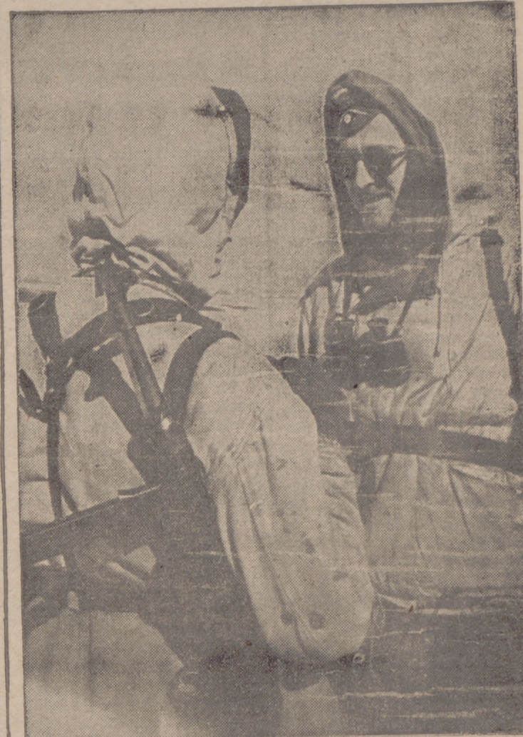
Después de un ataque contra el enemigo coronado por el éxito, discute el jefe de Compañía, con uno de sus oficiales, las próximas maniobras a ejecutar.