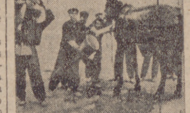
Lavando un caballo después de curado.

Los buenos picadores, observando estas advertencias, exigen caballos de buena alzada, obedientes a la rienda y en perfecto estado de sanidad y aptitud.