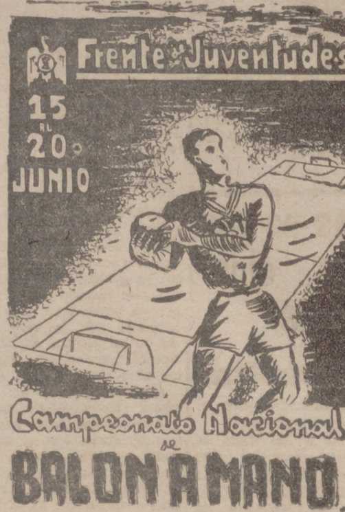
Según anunciamos ayer, del 15 al 20 del presente mes se jugará en nuestra ciudad el Campeonato Nacional de Balón a Mano del Frente de Juventudes, con la participación de los seis equipos que han quedado campeones regionales y entre los cuales se encuentra el de Valladolid, el cual hace días que ha comenzado sus entrenamientos a base de educación física y toque de balón.

Tal como la Nacional había previsto al principio de esta temporada, se asegura para la próxima la reducción de la Segunda División de Liga, que quedará integrada por 14 clubs.