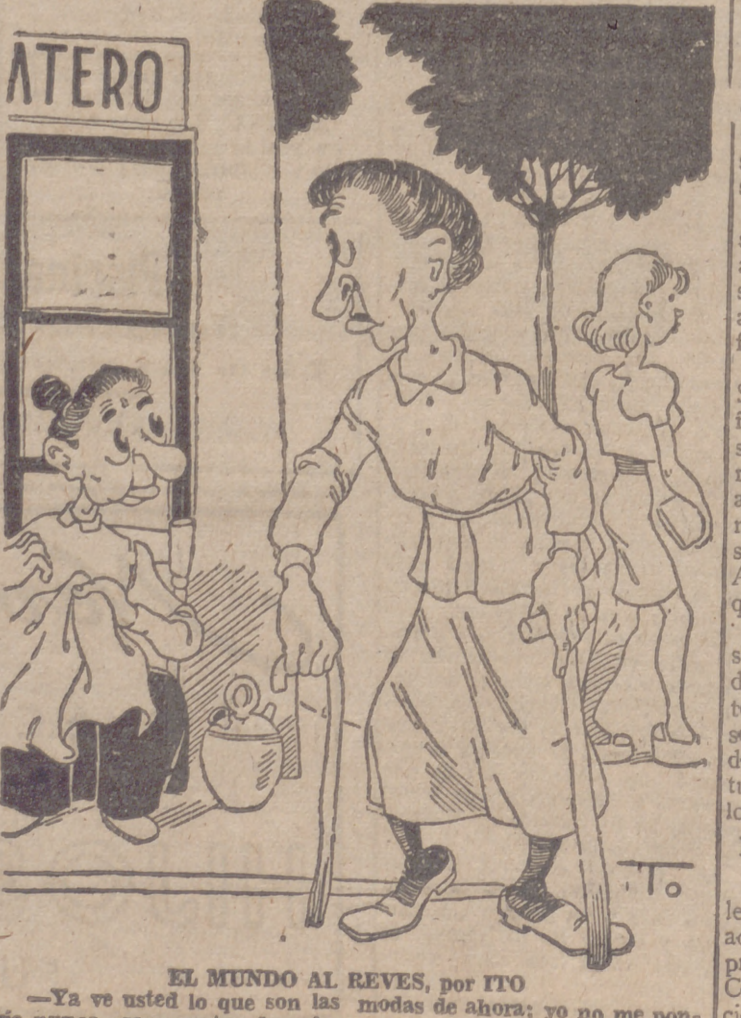
EL MUNDO AL REVES, por ITO -Ya ve usted lo que son las modas de ahora; yo no me pondría nunca esos zapatos de coja.

A las ocho de la noche se celebró en el Teatro Principal, adornado con tapices y flores, el primer concierto dado por la Coral Vallisoletana de "Educación y Descanso".