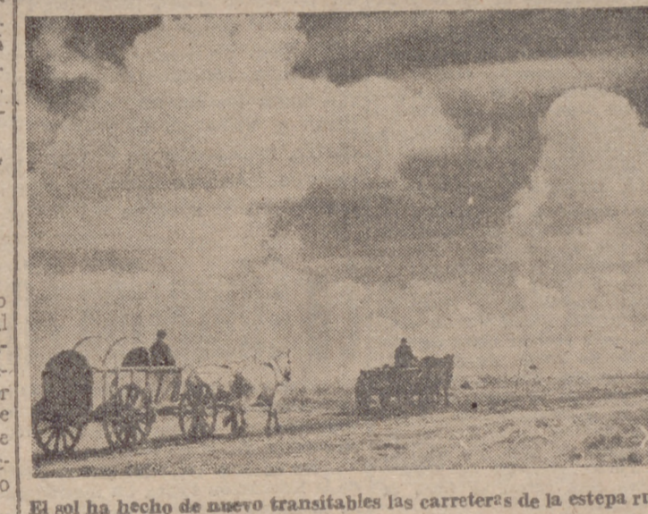
El sol ha hecho de nuevo transitables las carreteras de la estepa rusa.