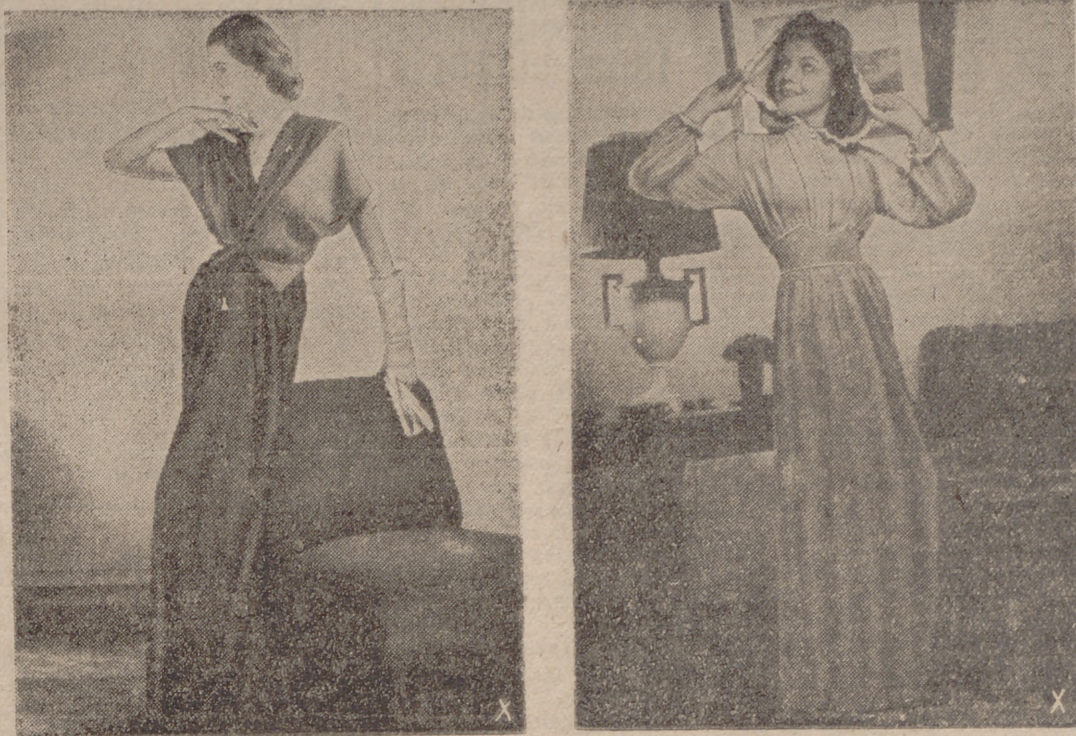
Dois modelos de trajes de noche lanzados recientemente por los modistos berlineses