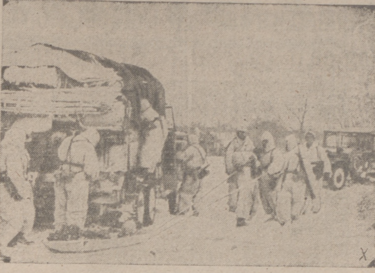
En el Extremo Norte de Rusia sigue todavía el invierno, y los soldados alemanes en aquel sector del frente tienen que vencer bastantes dificultades.