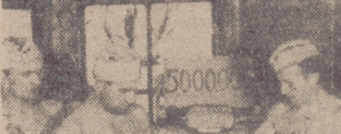
Cinco millones de pants fueron hechos en el horno de esta panadería militar durante la campaña en Carelia. Un día conmemorativo.

El Ferrol del Caudillo, 30.—Se encuentra dispuesto para emprender su nuevo viaje de prácticas el buque-escuela "Galatea", que saldrá mañana con ochenta aprendices marineros. Si "Galatea" marchará directamente a Santa Cruz de la Palma, desde donde seguirá a Funchal.—Cifra.