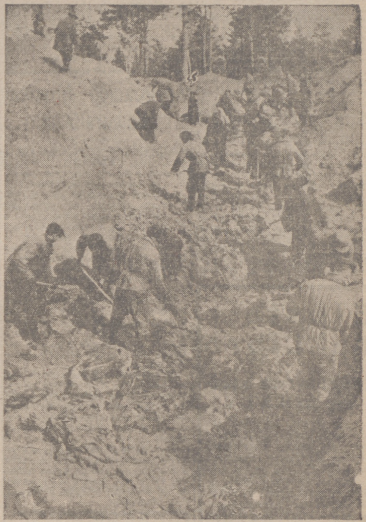
Actualmente se lleva a cabo la identificación de los cadáveres de los oficiales polacos asesinados por la G. P. U. encontrados en el bosque de Katyn. La fotografía muestra un aspecto del desierto.