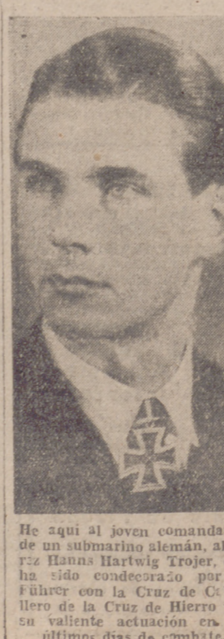
Marino alemán, Caballero de la Cruz de Hierro

Melburne, 30.—El tercer empréstito de guerra, llamado de la Libertad, ha sido ampliamente cubierto. Los cuatrocientos mil suscriptores han ingresado en el Tesoro ciento dos millones de libras esterlinas, es decir, dos millones más de lo previsto oficialmente.—Efe. ANDREWS NO DIMITIRA HASTA DENTRO DE UNOS DIAS Belfast, 30.—El anuncio de la comisión de Andrews, primer ministro de Irlanda del Norte, se considera prematuro. Los centros competentes señalan que dicha dimisión no se hará efectiva hasta dentro de algunos días.—Efe. CONSTITUCION DE UN CONSEJO ECONOMICO EN BUDAPEST Budapest, 30.—Un Consejo Económico ha sido creado por decreto publicado en el «Diario Oficial». Se compondrá de ocho miembros presididos por el ministro de Comercio, y se ocupará de la investigación de yacimientos petrolíferos y de su explotación.—Efe. Dos de Mayo, Fiesta de la Independencia: «SI», suplemento de «Arriba», exalta y recoge la gesta más española.