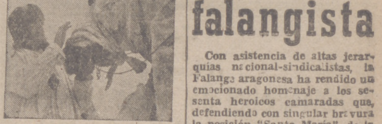
Con el fin de llevar a cabo la lucha contra los francotiradores rusos que se esconden en los bosques son camuflados los caballos de los soldados alemanes.

Todos aquellos que llevan sobre su pecho el emblema de las flechas yugadas, y aun quienes se sientan de verdad españoles, han debido sumarse al acto de reconocimiento y recuerdo y formar en espíritu junto a los millares de camaradas que han renovado su profesión de fe nacional-sindicalista en aquellas crestas ibéricas regadas con la sangre de los héroes, porque aquellos oscuros escuadrillas supieron con su muerte dar una magnífica lección de falangismo, que es decir patriotismo, disciplina, sentido del deber y del honor militar, llevados hasta el extremo del sacrificio heroico de la existencia.