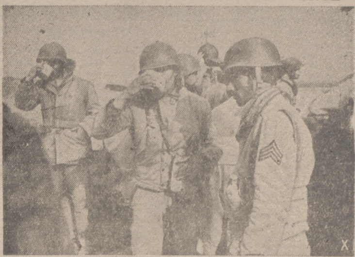
Extenuados llegan al puesto de concentración y ansiosamente beben el agua.