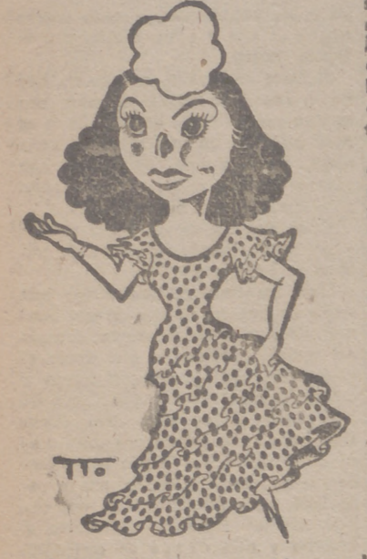
TRUDI BORA, que actúa en Lope de Vega al frente de su compañía de revistas.