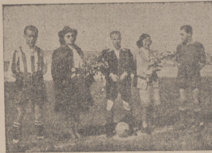
Madras, capitanes y árbitro del partido amistoso Ayuntamiento-Jefatura Provincial, celebrado ayer, y que terminó con la victoria de los primeros.

—Nada de carambolas, amigo—sentencia el más optimista de la "peña"—es que el Valladolid es un conjunto que responde magníficamente en esos partidos en que se lo juega todo y es en los que da su rendimiento máximo. Por esta razón yo tengo fe en el encuentro de Las Cortes, al que el conjunto local va con la mayor moral y sabe que en él se juega demasiadas cosas. Y cuando pasa esto, la diferencia de juego es lo de menos. Por que no me negarás que el Ceja, el Murcia y el Aviación eran superiores al Valladolid y, sin embargo, fueron desplazados. Yo creo que en Las Cortes ganamos, todo está en que el equipo tenga una de sus tardes. Con noventa minutos como los de Valdecañas en la Copa no hay equipo que se nos resista.