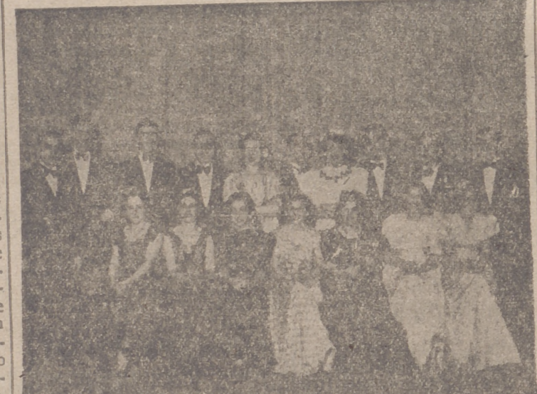
Participantes en la final de ópera y zarzuela del Concurso del Cantante Anónimo...