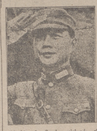
Nankín, 2.—Se ha celebrado el primer Congreso de las Juventudes de Asia oriental...

Señala el camino de unificación de la Gran Asia, declara Wang-Ching-Wei