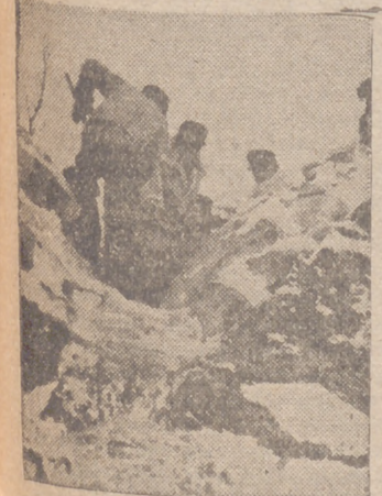
En el sector Norte ruso, los soldados de una compañía del ejército alemán del Aire trabajan en la fortificación de un aerodromo.