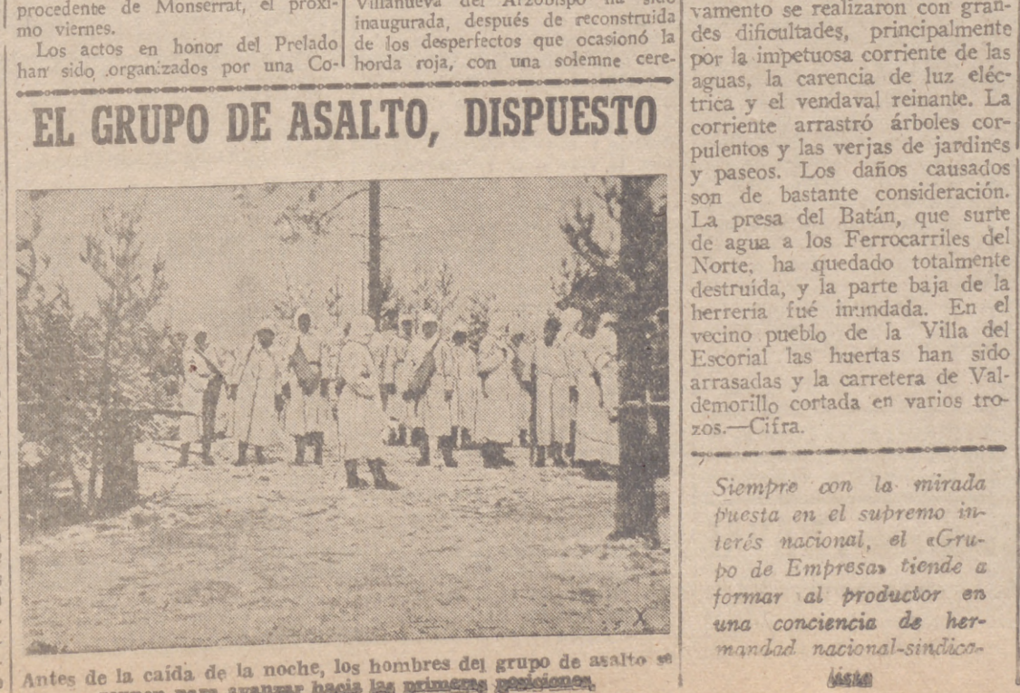
Antes de la caída de la noche, los hombres del grupo de asalto se reunían para avanzar hacia las primeras posiciones.