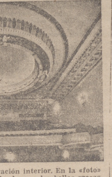
Detalle de la magnífica decoración interior. En la «foto» destaca la preciosa cúpula colgada, con las bellas grecas clásicas

El edificio cuenta con dos vestíbulos, uno en cada piso. Del inferior arranca la escalera—verdadero alarde constructivo, único en su género—, construido por membrana de hormigón armado, cubierto de mármol y adornada con rica balaustrada, volada de caoba. Esta escalera nos conduce al vestíbulo del piso principal, en el que se halla instalado el «buffet», elegantemente instalado y capaz