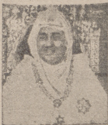
Tetuán, 24. — El teniente general Orgaz, Alto Comisario de España en Marruecos...

Ambas personalidades pronunciaron discursos en términos de amistad hispano-marroquí