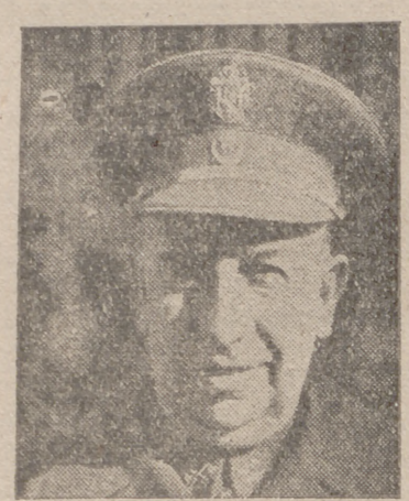
El teniente general Orgaz sostuvo una cordial conferencia con el Jalifa, y, seguidamente, en el salón de actos del Palacio Imperial...