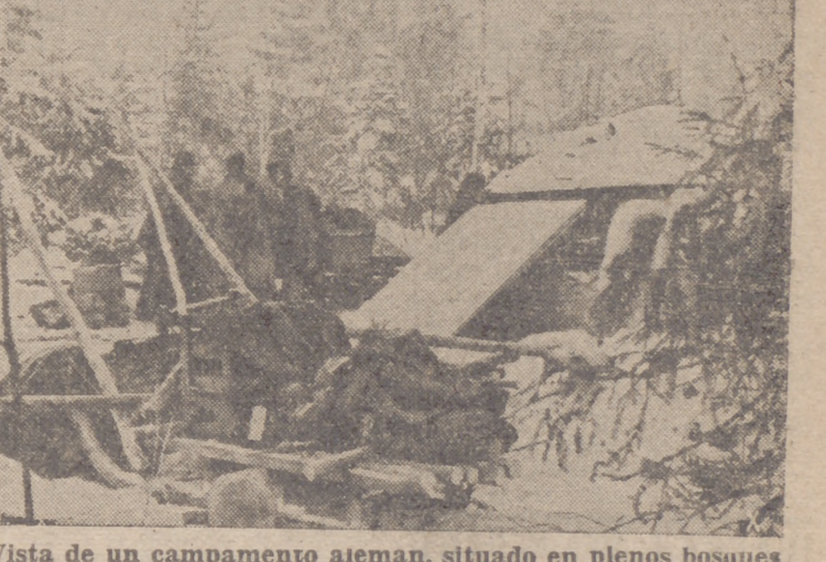
Vista de un campamento alemán, situado en plenos bosques cercanos al lago Ilmen