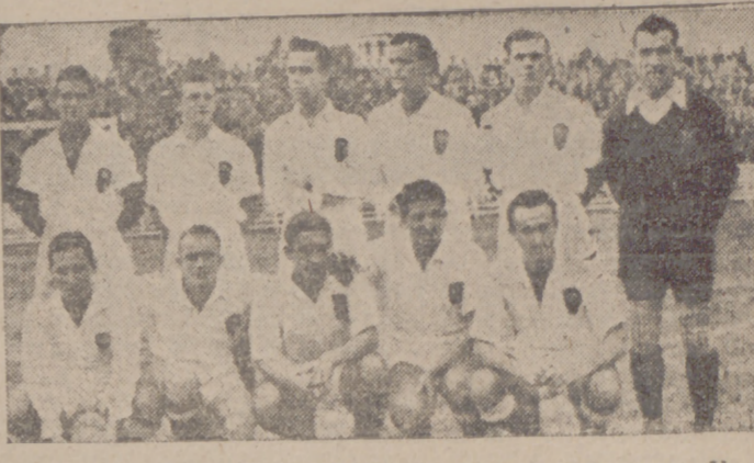
Equipo del Celta, que el próximo domingo juega en Valladolid