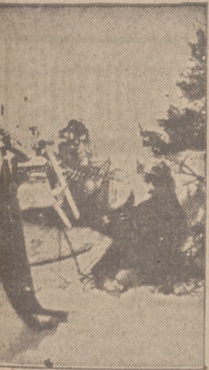
Los granaderos alemanes de un batallón de esquíes han emplazado sus ametralladoras en los trineos típicos del país, denominados «käjä» por los finlandeses