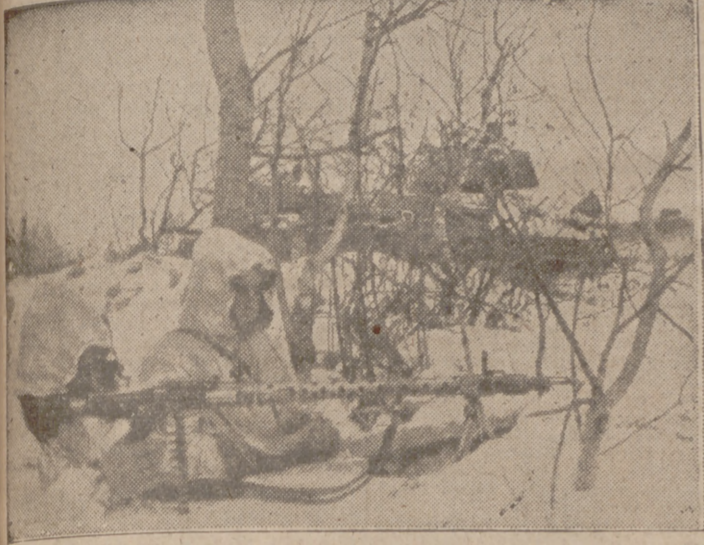
Posición alemana de ametralladora ligera emplazada en medio de un verdadero cementerio de tanques rusos