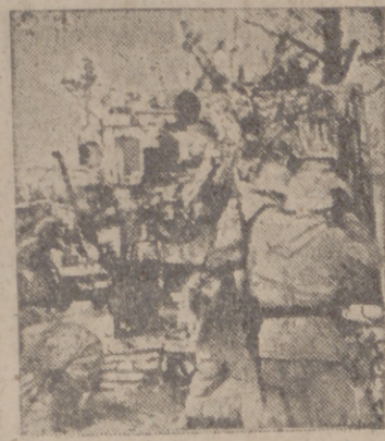
En el sector del lago Ladoga, los intentos de ataques soviéticos siempre sucumben ante el fuego de los cañones alemanes, que no les permiten acercarse.