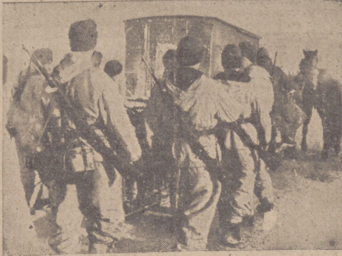
Al Sudeste del lago Ilmen, soldados alemanes avanzan camuflados con sus trajes blancos que no los destaca del terreno

Nankin, 19.—"El Japón está preparado para una gran ofensiva contra sus enemigos, mientras que al Oeste, Alemania, Italia y las demás potencias del Eje hostigan a los aliados", ha declarado el jefe del Estado Mayor japonés en China, general de división Kavaba, en un té dado con motivo de la conferencia militar de Nankin.—Efe.