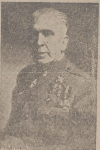
merece este infatigable colaborador y protector del útil deporte de tiro al blanco.

Hace poco fué nombrado vicepresidente primero de la Junta Nacional, cargo que ahora deja por pasar a la presidencia que tan dignamente