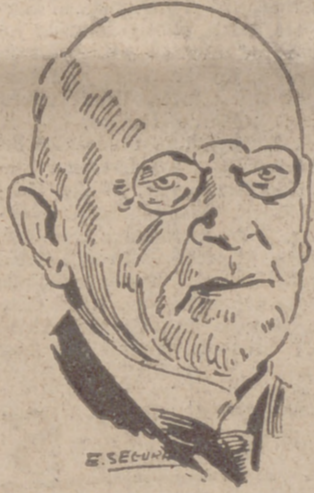
famoso matemático alemán fallecido, cuyas obras científicas son mundialmente conocidas

ha suscitado gran interés entre la opinión húngara. El «Pester Lloyd» publica el texto con una información del acto de Berlín, transmitida por su corresponsal en Berlín. «El ministro del Reich—escribe este corresponsal—ha proclamado energicamente la ley de movilización total. No se trata de exclamaciones de patriotismo exacerbado, sino que es la expresión de un llamamiento del portavoz del Gobierno, que lanza la voz de alarma al pueblo alemán y a todo el continente europeo, y les invita a realizar un esfuerzo común y decisivo en la lucha contra el bolchevismo.»—Efe.