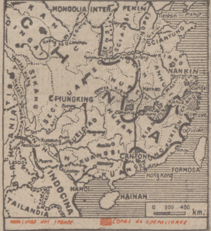
Las fuerzas niponas han reanudado con vigor recobrado su ofensiva en tierras chinas del