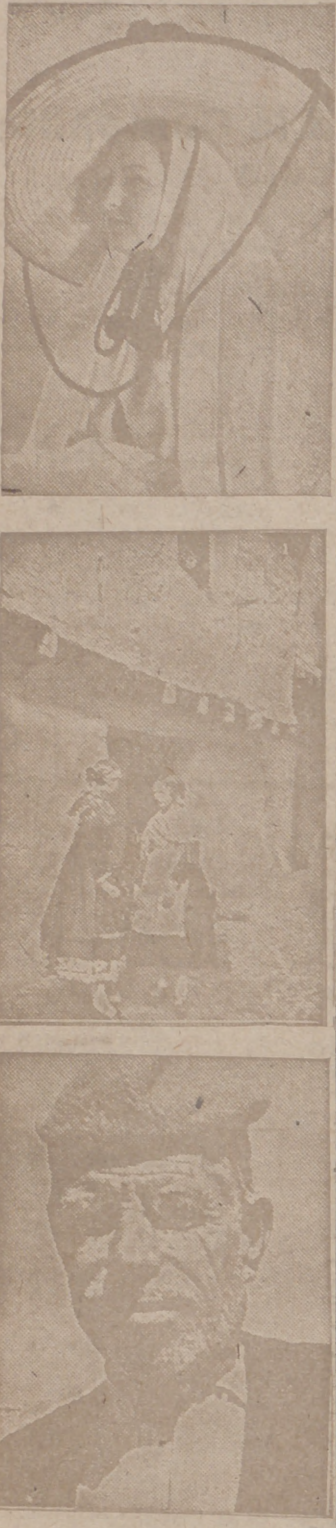
Las fotografías corresponden a tipos de tres regiones españolas: a Canarias, a Cestilla la Vieja y a Cataluña, respectivamente.