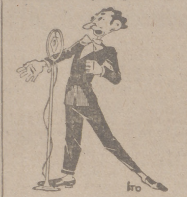
En el día de ayer, y por la Emisora de F. E. T. núm. 1, conectada con Radio Valladolid, actuó la gran orquesta «Rumbas», bajo la dirección del maestro España, la cual interpretó un escogido y variado repertorio de música de baile.

El lunes actuarán los concursantes de ópera y zarzuela