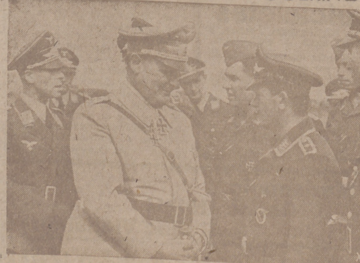
El mariscal Hermann Göring escucha la relación de una "impulsión" después de un vuelo sobre Inglaterra.