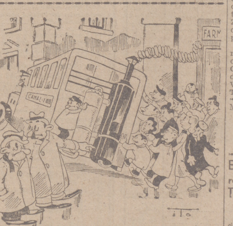
AUTOBUS DEL CANAL (Por ITO)

Berlin, 6. — El comandante en jefe del grupo militar del Oeste, mariscal Rundstedt, ha inspeccionado los puertos de guerra y las bases de las costas francesas del Mediterráneo y del Atlántico. El mariscal visitó las construcciones de los frentes de tierra y del mar, los refugios submarinos y demás instalaciones defensivas.