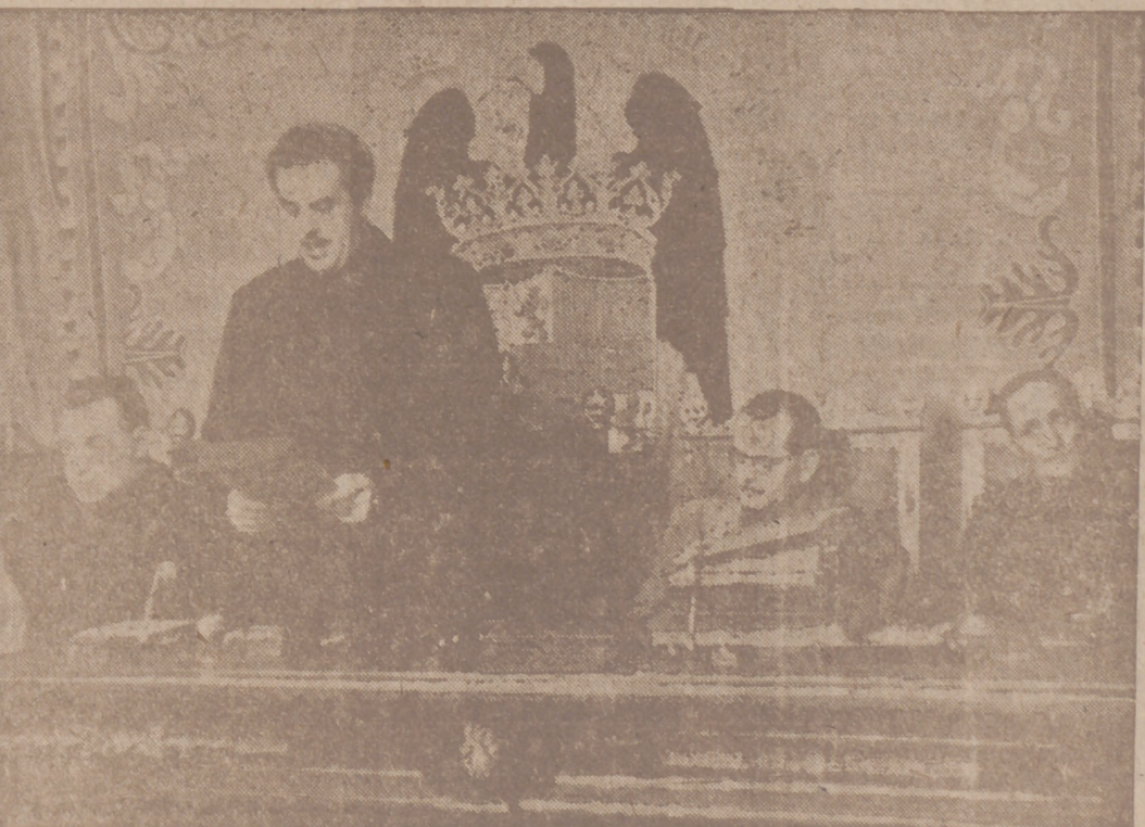
El ministro de Trabajo, camarada José Antonio Girón, toma posesión de la presidencia del Consejo del Instituto Nacional de Previsión. En la foto aparece pronunciando su importante discurso durante el acto

El Nuncio de S. S., el Arzobispo de Valladolid y los Obispos de Barcelona, Seo de Urgel, Gibraltar y Jaén asistirán a la coronación de la Patrona de Málaga