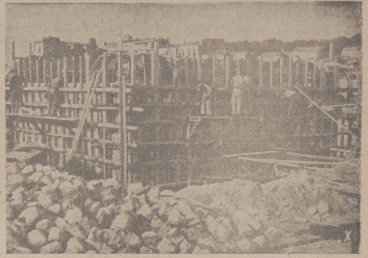
Nuevas y potentes fortificaciones son levantadas en la costa atlántica por los hombres de la Organización Todt