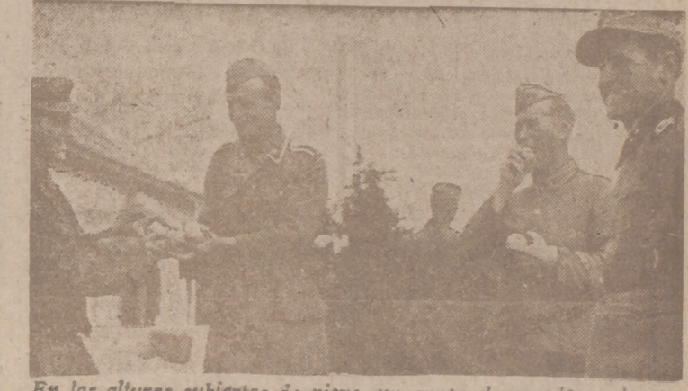
En las alturas cubiertas de nieve, un grupo de cazadores de montaña alemanes recibe con alegría una buena ración de frutas

Durante estos días la Prensa viene publicando notas biográficas y fotografías del nuevo embajador, poniendo de relieve su personalidad política y diplomática.—Efe.