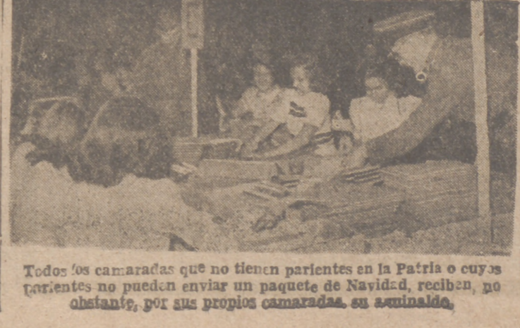
Todos los camaradas que no tienen parientes en la Patria o cuyos parientes no pueden enviar un paquete de Navidad, reciben, no obstante, por sus propios camaradas, su asignado.

Con motivo de las festividades de Navidad la revista "MEDINA" ha editado un interesante número extraordinario. No dejen de leer "MEDINA".