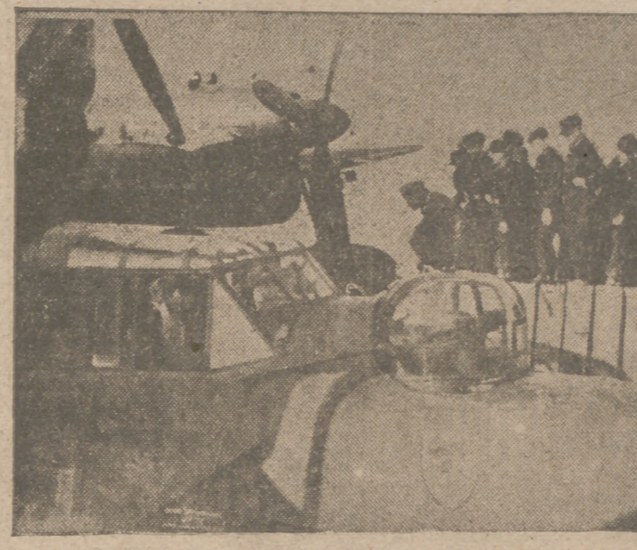
Muchachos de la Juventud Hitleriana durante una visita efectuada a un aeródromo, donde admirados contemplan este avión de reconocimiento y un aviator les da detalles acerca del funcionamiento de la máquina.

go atacó de nuevo ineffectivamente, sufriendo considerables y sangrientas pérdidas, infligidas desde las posiciones alemanas. Veintinueve carros de combate soviéticos fueron destruidos en este sector entre el Volga y el Don; los ataques incesantes del enemigo se han estrellado contra la resistencia tenaz de las tropas alemanas. En el curso de contraataques de las fuerzas alemanas, éstas han rechazado al adversario en varios lugares. Cuarenta y dos tanques fueron destruidos. Importantes contingentes de la aviación, así como bombarderos rápidos húngaros, apoyaron los combates del ejército de tierra día y noche. En el curso de ataques locales sobre la orilla Este del Don, las tropas húngaras destruyeron una importante cantidad de posiciónes de combate, cuyos defensores fueron aniquilados. Al Noroeste de Voronej y al Oeste de Kaluga, el enemigo experimentó importantes pérdidas a consecuencia de eficaces ataques. En Libia, únicamente actividad de los elementos de reconocimiento. Los bombarderos alemanes atacaron en vuelo rasante a las fuerzas británicas. Durante la noche, el puerto de Bengasi fué eficazmente atacado. En Túnez, las tropas alemanas e italianas han ocupado varias posiciones que eran objeto de duros combates, y han rechazado los ataques enemigos. La aviación alemana e italiana ha atacado las instalaciones del puerto de Argel, así como aeródromos de Argelia.—Efe. (Pasa a la cuarta página.)