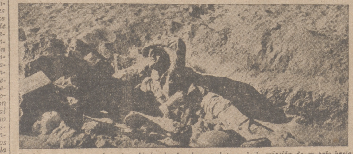
Desde el puesto avanzado, este soldado alemán observa el paso de la aviación de su país hacia la retaguardia enemiga

La numerosa y selecta concurrencia que llenaba el amplio salón de actos aplaudió y felicitó efusivamente a ambos oradores. Cifra.