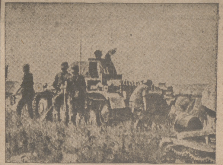
El artillero de este tanque germánico acaba de hacer blanco en un tren soviético

Marsella, 11.—Tropas italianas han desembarcado en la ciudad de Bastia (Isla de Córcega), según noticias recibidas en esta capital.—Efe.