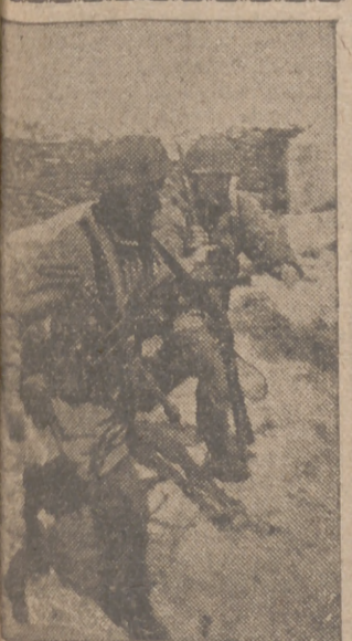
Apenas desembarcados de los paracaídas, estos soldados alemanes se dirigen rápidamente a su puesto

Túnez, 11.—El prefecto ha tomado las siguientes disposiciones: Queda prohibida toda reunión superior a tres personas en el territorio de la regencia. Igualmente queda prohibido detenerse en las calles y formar grupos. En las ciudades de Bizerta, Lagoulette,