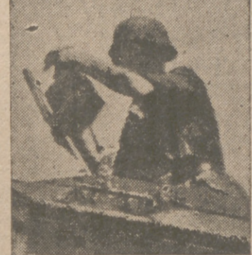
Este soldado, con toda calma, coloca una carga explosiva de cinco kilos dentro del vagón, lleno de munición hasta los topes. Los restos de este vagón bloquearán el tren en dirección al enemigo