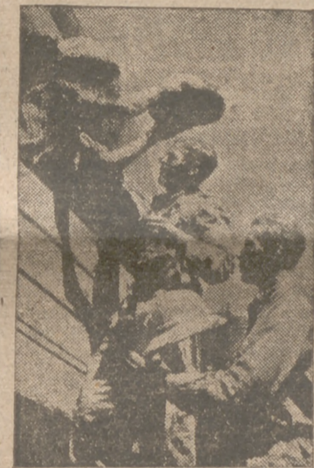
En Stalingrado, unos soldados alemanes se preparan para atacar un reducido soviético establecido en uno de los edificios de la ciudad

Berlín, 11.—Las fuerzas aéreas germano-italianas han continuado con éxito sus ataques contra la flota de desembarco anglo-norteamericana que opera frente a Argel. Han sido alcanzados un portaaviones y un gran buque mercante que fué incendiado. Los cazas germanos derribaron tres aparatos anglo-sajones que intentaron oponerse a la acción de los bombarderos del Eje.—Efe.