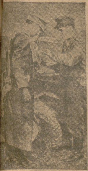
Paracaidistas, preparándose para emprender el vuelo

Berlín, 14.—Los submarinos alemanes, han hundido la semana pasada, en convoyes y en acciones dirigidas contra buques aliados, en la costa canadiense, en el río San Lorenzo, costa oriental de los Estados Unidos, océano Atlántico y costa occidental de África, treinta mercaderes enemigos con un desplazamiento global de 229.500 toneladas. A este respecto el Alto Mando alemán hace observar que los sumergibles germanos tuvieron que prolongar sus ataques, a veces, durante días enteros antes de conseguir alcanzar con sus torpedos a los barcos aliados, pero que las tripulaciones dieron muestra, en todo momento, de un valor y una pericia inimitables. Efe.