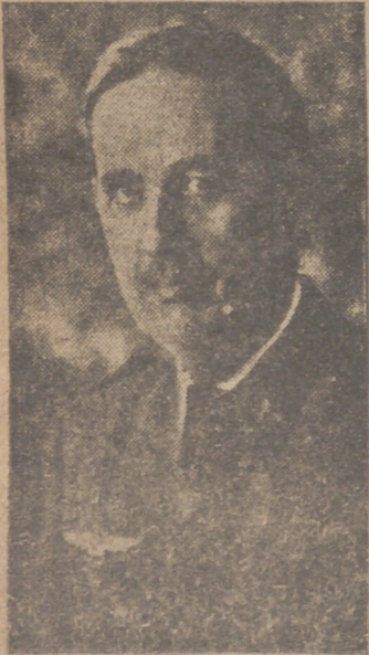
El general Kindelán, que ayer asistió en representación del Cuadrillo a la coronación de la Patrona de Canet del Mar.