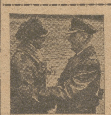
Un jefe de la Marina alemana felicita al comandante de un submarino que ha vuelto a la Patria después de obtener grandes éxitos en el mar

implica la voluntad y la resolución de detener los carros, los cañones, los aviones y los hombres que los soviets lanzan al asalto. Sabiendo que su vieja táctica, consistente en ofrecer sus masas a los asaltos repetidos con una obstinación casi inhumana, no dió resultado en el último invierno, han recurrido esta vez a una nueva táctica. Poniendo en línea la masa concentrada de su artillería y de sus carros, consumen una cantidad inmensa de municiones contra las posiciones que se proponen atacar. Pese a esta preparación, en numerosos casos la infantería roja no osa pasar al asalto, razón por la que tienen que ser repetidas varias veces las órdenes de ataque. A pesar de asegurarse los bolcheviques una efectiva superioridad, no sólo numérica, sino en millones de proyectiles, los soviets son impotentes para vencer a los soldados alemanes.—Efe.