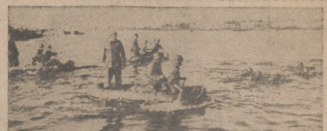
La gloriosa División Asud, que ha adquirido grandes méritos, muchas veces se encuentra en primera línea. He aquí un grupo de españoles atravesando el río Kubán, parte en botes neumáticos parte nadando

El doctor Eijo Garay inaugura las Semanas de Estudios Superiores Eclesiásticos