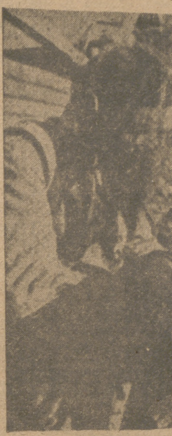
Todos los servicios alemanes funcionan perfectamente en el frente. Un soldado radiotelegrafista transmitiendo órdenes