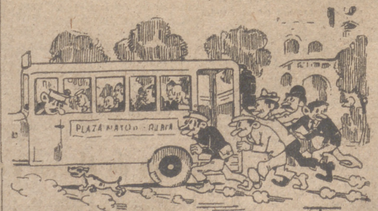
ADELANTOS. Por ITO. Nuevo modelo de gasógeno del que se hicieron pruebas el domingo en la Plaza Mayor de Valladolid, con gran éxito de público.

Nueva etapa escolar. Una vez más las Escuelas nacionales abren sus puertas para dar comienzo a un nuevo curso. Los muchachos, ceñido el escudo púrpura de las vacaciones estivales, reanudan sus tareas formativas y asumen con el entusiasmo y el estudio, la calidad que le habilita el día de mañana para seguir los destinos de una España que queremos, para ellos, mejor.