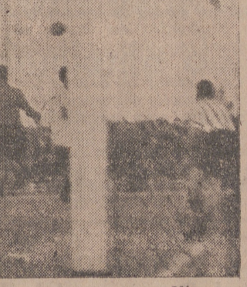
El portero bilbaíno despeja un córner sacado por Viso

En la segunda parte Panizo ocupa el puesto de Ortúzar, éste pasó a extremo e Iriondo al interior. La ovación al Valladolid es grandísima y los aficionados salen satisfechos del gran encuentro realizado por su equipo.