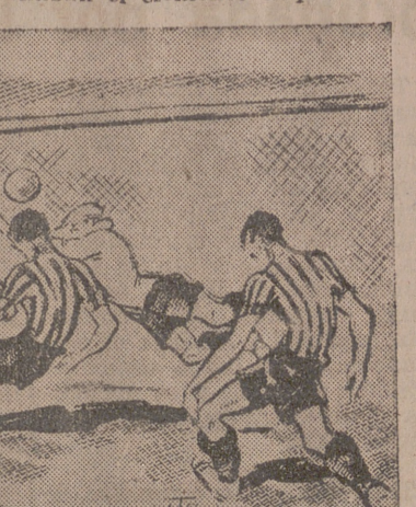
Apuntes al natural del partido Valladolid-Atlético de Bilbao (Por ITO)

UNA GRAN LINEA MEDIA Se comenzaba el encuentro ganándole la iniciativa en todos los detalles. Todas las líneas del equipo castellano respondían con más acierto que las contrarias y eran superiores en todo momento. Los de casa, con una moral superior y con más codicia, ganaban el elemento imprescindi-