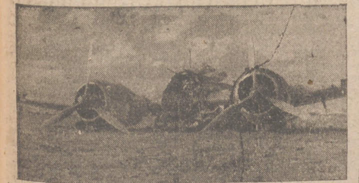
Restos de un aparato inglés abatido por los italianos

La Dirección General de Enseñanza Superior y Media se desdobla en dos Direcciones de Enseñanza Universitaria y Media