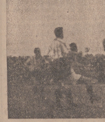
El portero bilbaíno despeja un córner sacado por Viso

En la segunda parte Panizo ocupa el puesto de Ortúzar, éste pasó a extremo e Iriondo al interior. La ovación al Valladolid es grandísima y los aficionados salen satisfechos del gran encuentro realizado por su equipo.