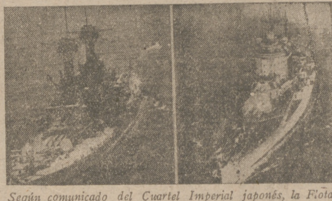
Según comunicado del Cuartel Imperial japonés, la Flota nipona hundió en el Mar del Coral un acorazado americano del tipo "California" y un acorazado del tipo "Warspite" fué gravemente averiado. A la izquierda, el acorazado "California"; a la derecha, el acorazado "Warspite".

Un acorazado, un portaaviones, dos cruceros, un cazatorpedero y cuatro mercantes gravemente averiados