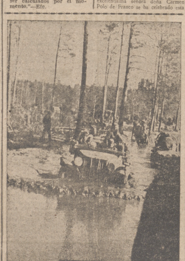
Al mal estado de las carreteras soviéticas se suma ahora el agua y el barro, que casi hacen imposible el avance del material rodante

Méjico, 15.— Los artículos alimenticios de primera necesidad quedarán sujetos a tasa en Méjico por disposición del Gobierno, que ha establecido por decreto los precios definitivos.—Efe.