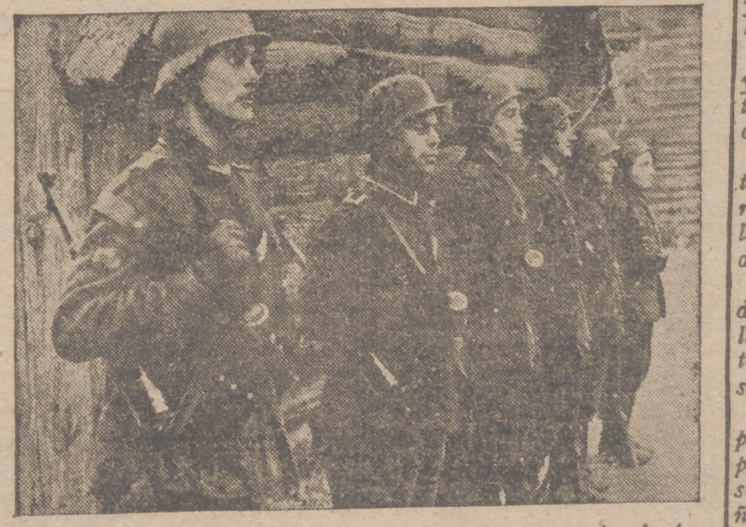
Miembros de la División Azul, que por su comportamiento heroico ya han obtenido la Cruz de Hierro, forman para recibir la Laureada Colectiva

Estas medidas de gobierno rozarán muchos intereses, variando el concepto creado por los viejos partidos políticos, pero es indispensable. El Estado no intervendrá más que donde sea preciso, pero lo hará con toda energía, porque de ello no sólo depende una Patria, sino con ella el Pan y la Justicia. ¡Arriba España! —Cifra.