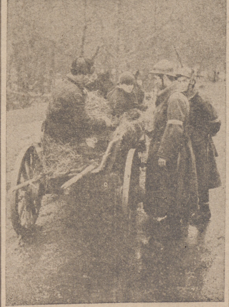
Soldados rumanos registran y exigen documentos de identidad a cuantos circulan por esta carretera establecida bajo su control en Crimea, para impedir el espionaje

Roma, 31.—El Duce ha recibido en audiencia al embajador del Japon en Berlin, Oshima, acompañado por el embajador en Roma, Horikiri, con los que sostuvo una larga y cordial entrevista.—Efe.