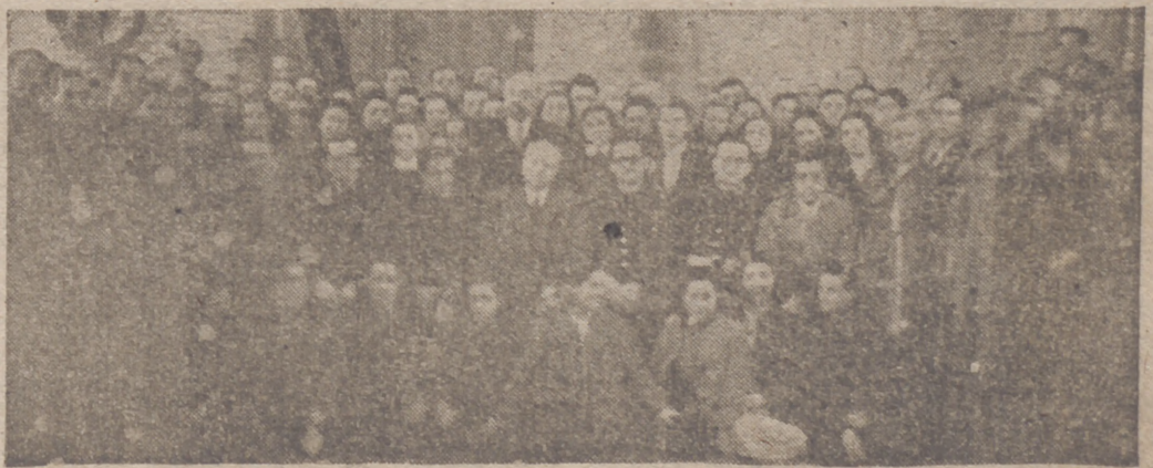
La Coral en el Ayuntamiento, recibida por el alcalde y jerarquías del Movimiento (Vea información en la octava página)