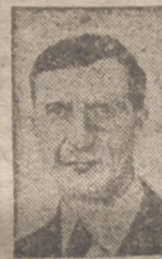
trabajando todo lo que le permita su dolencia.—Efe.

Dublín, 18.—El presidente del Estado Libre de Irlanda, De Valera, ha ingresado en una clínica, donde se someterá a una observación médica. Se espera que podrá reanudar su vida normal dentro de breves días. Mientras tanto el presidente continuará