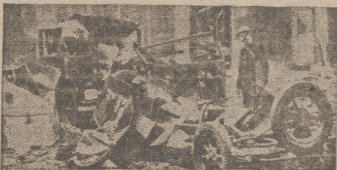
Destrozos en una calle de Londres, causados por la aviación alemana

Atenas, 18.—Comunicado del Ministerio de Seguridad Pública: «La jornada del 17 de diciembre ha transcurrido tranquila en el interior del país.—Efe.