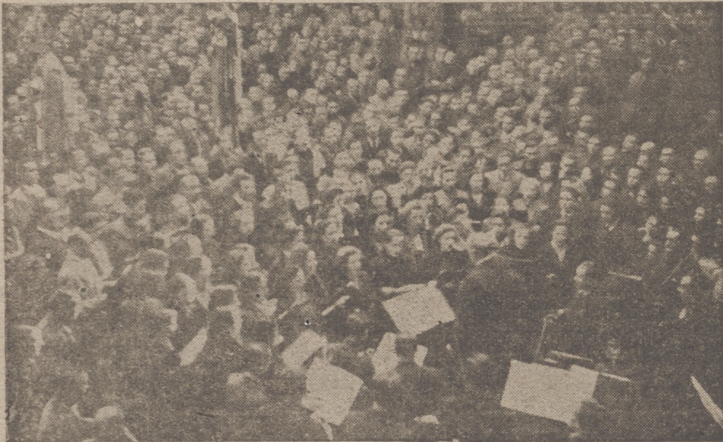
La Coral sanderina durante su actuación ante miles de obreros en los talleres de los Ferrocarriles del Norte