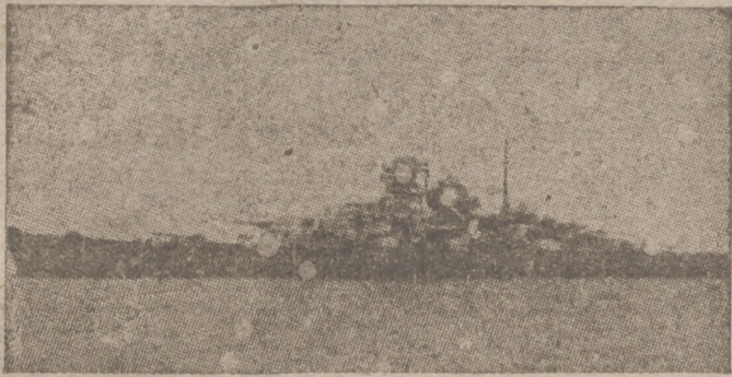
El nuevo acorazado alemán «Bismarck», que acaba de incorporarse a la escuadra

La protección decidida a los trabajadores, abandonados de unos y engañados por otros, con el establecimiento de obras destinadas a elevar su nivel moral, intelectual y material poniéndoles en condiciones de afrontar la vida más ventajosamente, es, pues, la función primordial de las Centrales Nacional - Sindicalistas, que convertirán en realidad los principios consignados en el Fuero del Trabajo por el Caudillo.