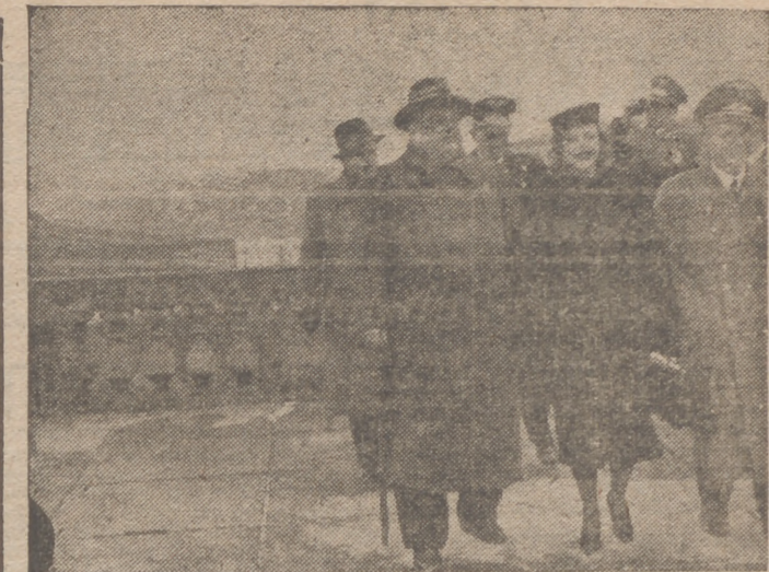
Semana cultural alemana en Varsovia.—Durante esta semana actuó en Varsovia la compañía del Teatro de Schiller en Berlín, cuyo actor—conocido también en España por muchas películas alemanas—, Heinrich George, y su esposa la actriz Berta Drews, aparecen en nuestra foto.

Las de racionamiento de pan: de primera, segunda y tercera, con el fin de efectuar su distribución en razón directa a las necesidades. En todas las capitales y pueblos de España se constituirán unas mesas en la cuantía que se considere necesaria, según el número de habitantes, con el fin de que el día primero de diciembre comience la presentación ante las mismas de las declaraciones juradas de cuantas personas poseedoras de racionamiento hayan de ser clasificadas con arreglo a sus ingresos. Tiende esta orden a que reciban mayor