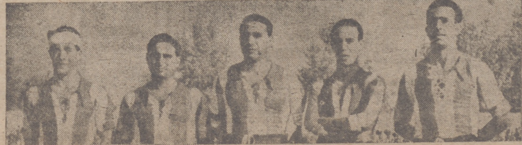
He aquí a los cinco jugadores que componen la delantera del Sevilla, la mejor línea de ataque del fútbol español, a la que su equipo debe el primer puesto en la clasificación de la Liga