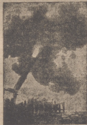
Un cañón alemán abriendo fuego contra el puerto de Dover.

Para jardines, Valencia. Para nobleza, Aragón. Para POCHE EL "MONTAÑÉS" Que se bebe hasta en Japón.