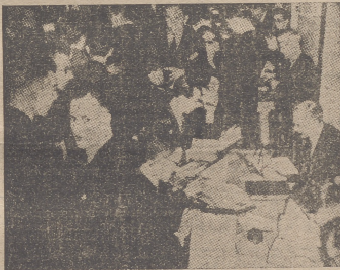
Los cinco mil empleados de los «Lloyds» trabajan, durante las alarmas aéreas, en un vasto refugio situado a sesenta pies bajo el nivel de las calles de Londres y protegido por una coraza de acero. En esta inmensa oficina subterránea hay un bar con bebidas y alimentos, estanco y peluquería