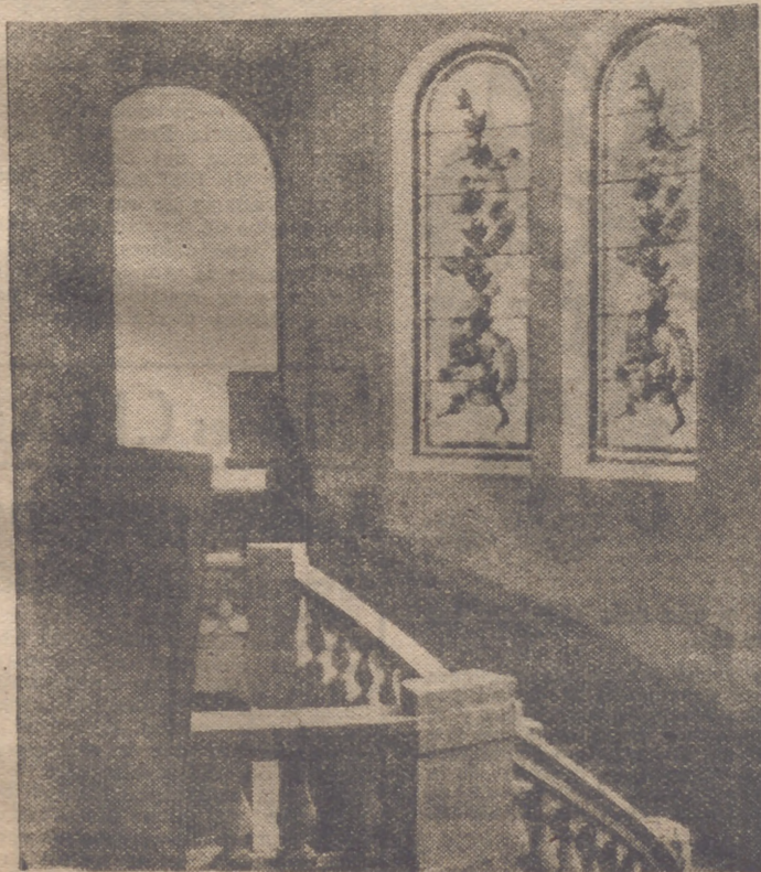
Un aspecto de la escalera principal de la Universidad