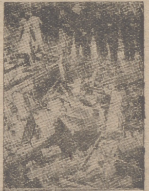
Tiendas del centro elegante de la City destruidas por la aviación del Reich.

El rector dará tres gritos: «La Universidad de Valladolid por Franco», que serán contestados unánimemente por los circunstantes con el grito de «¡Franco!», re- (Pasa a la página tercera)