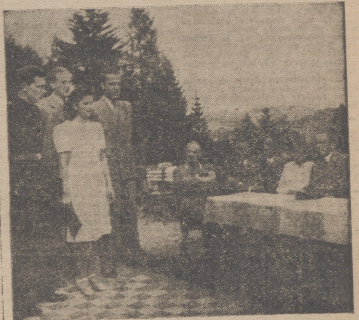
Cursos estivales para extranjero s en el Semmering, cerca de Viena.—Estudiantes eslovacos cantan sus canciones populares.