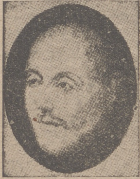
El primer general de la Compañía de Jesús, San Ignacio de Loyola, gloria de España.

La Prensa española no debe pasar por alto la fecha 27 de septiembre de 1940, cuarto centenario de la Compañía de Jesús. Y mucho menos en estos momentos de revalorización de los valores hispánicos, uno de los cuales indiscutiblemente es la personalidad de San Ignacio de Loyola y de su Orden la Compañía de Jesús.