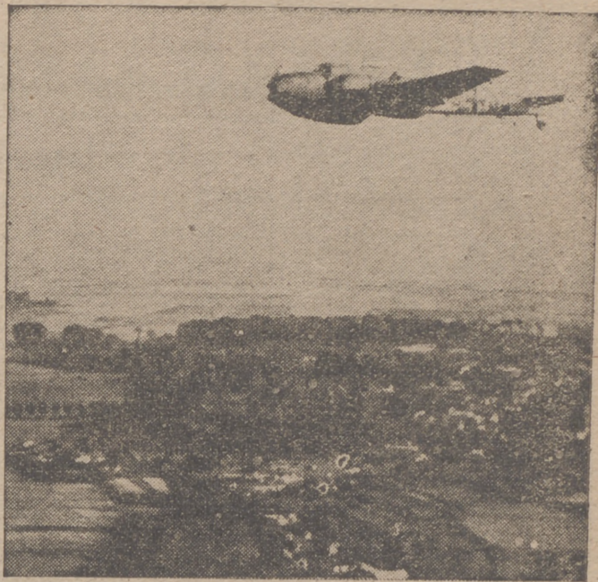
Un avión de la escuadrilla «Horst Wessel» volando sobre Inglaterra

El almirante británico advirtió a las autoridades francesas que los submarinos serían atacados si salían del puerto. A pesar de esta advertencia tres sumergibles torpederos a nuestras unidades y fué necesario tomar medidas activas contra ellos. Dos fueron hundidos, pero toda la tripulación de uno de estos submarinos pudo ser, afortunadamente, salvada y será repatriada en la primera ocasión. Las fuerzas de De Gaulle intentaron efectuar un desembarco, que no se logró, y cuando se llegó a la certeza de que sólo una operación de guerra de más importancia podría asegurar la caída de Dakar, se decidió suspender las hostilidades, porque nunca ha sido intención del Gobierno de S. M. emprender acciones militares contra los franceses que consideran un deber obedecer las órdenes del Gobierno de Vichy. El propio general De Gaulle mostró un gran interés en no ocasionar efusiones de sangre entre sus compatriotas. Por lo tanto, las fuerzas interesadas están en disposición de ser retiradas de Dakar.—Efe.