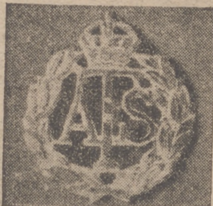
Escudo del «Auxiliary Territorial Service» del cuerpo femenino de auxilio terrestre inglés

Tokio, 25.—El embajador japonés en Londres, Shigenitsu, ha protestado cerca del secretario de Estado, Butler, contra la detención de japoneses efectuada en Singapur y contra la actitud opuesta al Derecho Internacional, adoptada por las autoridades británicas de dicha ciudad. Esta protesta es paralela a la formulada por el viceministro de Ne-