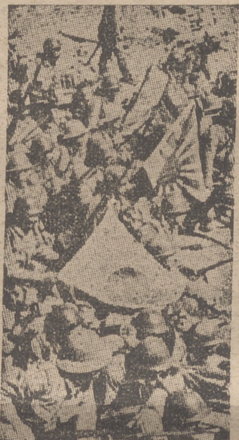
Soldados nipones en Indochina francesa

Berlín, 25.—El Führer Canciller ha concedido la Cruz de Caballero de la Orden de la Cruz de Hierro al capitán de navío Jerónimo Scheper, por haber hundido con el submarino de que es comandante un total de 26 barcos enemigos, con un desplazamiento total de 122.443 toneladas, en el mar del Norte y en el Océano Atlántico. Trece de estos buques navegaban en convoyes protegidos.—Efe.