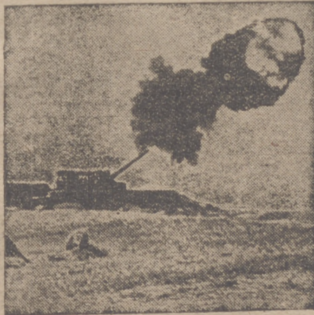
Artillería pesada alemana emplazada en la costa del Canal, lanzando sus obuses sobre la costa Sur de Inglaterra.

Italia—añade el diario—que en su política unitaria ha solicitado siempre una intervención más activa de España en la política internacional y que saludó como una victoria suya la solución de la cuestión de Tánger, quiere manifestar su satisfacción por las decisiones históricas de la España del Caudillo y su solidaridad contra el enemigo común, con el orgullo de no haberse equivocado al predecir el destino triunfal de la revolución española.—Efe.