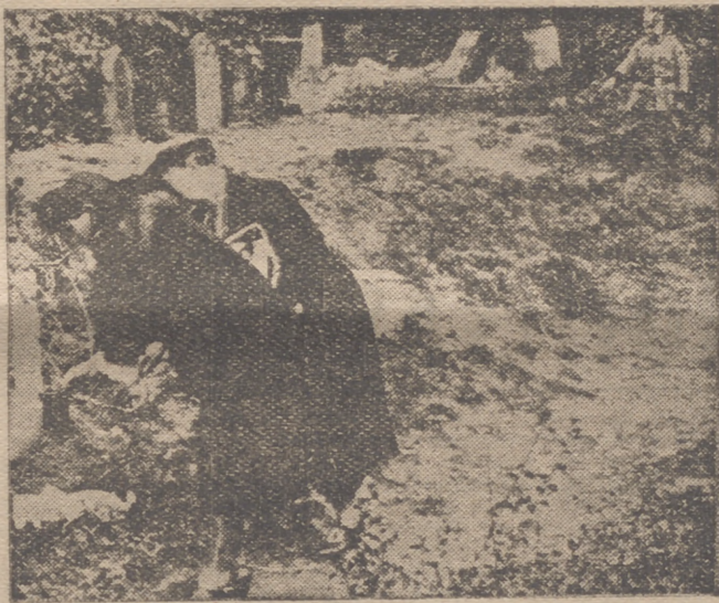
Bombas inglesas cayeron también en el cementerio de Ohlsdorf, uno de los más grandes de Europa, situado en los arrabales de Hamburgo

Dos grandes incendios estallaron en el campo de los objetivos propuestos a consecuencia del bombardeo. A la una de la madrugada de hoy, miércoles, nuestros bombarderos atacaron el transformador de la central eléctrica de Berlín, en Friedrichsfelde, que suministra una gran cantidad de fluido a las industrias berlinesas. En las inmediaciones de esta central estallaron varias bombas de gran explosivo y de grueso calibre. Un alto horno de la barrida Sudeste fué también alcanzado y se produjo un gran incendio. Dos cargas de bombas fueron lanzadas sobre el puente de un canal situado a tres kilómetros del aeródromo principal de Berlín».—Efe.