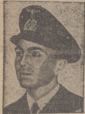
El capitán PRIEN, comandante de un submarino alemán que lleva hundidas 151.500 toneladas de barcos enemigos

de alcanzaron a varios mercaderes, algunos de los cuales se sumergieron. En la parte alta del monte cayeron siete bombas que redujeron al silencio a las baterías allí instaladas. Otras cayeron en las inmediaciones de la Ramada «Casetta de los Inspectores» y otra cerca del Hotel Bristol. Dentro del puerto se produjo el incendio de un depósito flotante de gasolina, con peligro de propagación a otros navios. Los bomberos consiguieron localizar el fuego. Desde Algeciras se observan numerosas columnas de humo, reveladoras del gran número de bombas incendiarias lanzadas. A las 18.40 horas continúan las sirenas de Gibraltar dando la señal de alarma.—Cifra.