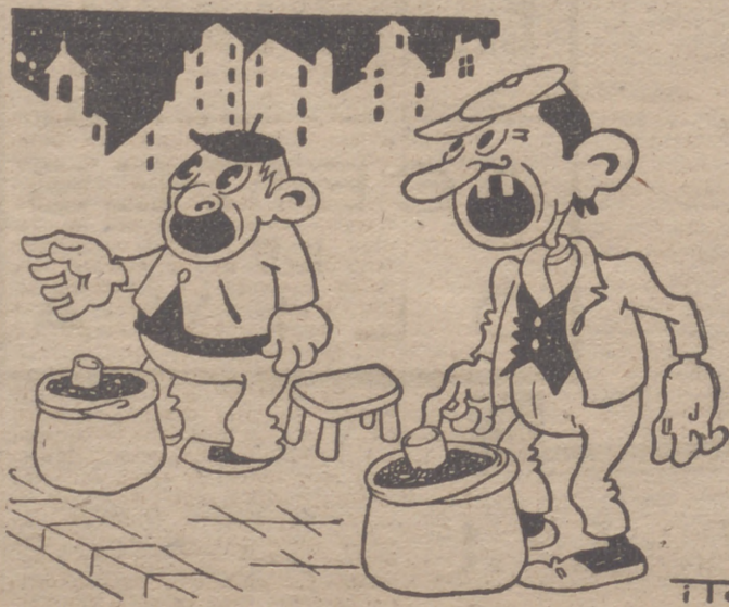
COMPETENCIA Por ITO —¡¡Piñones de Valladolid con cáscara!! —¡¡Piñones de Gibraltar e maderados!!

Roma, 25.—El «Lavoro Fascista» dedica un suelto de salutación al diario «Pueblo», de Madrid, diciendo que la función educadora y moralizadora de la Prensa nacional-sindicalista, en los regímenes que tienden a hacer del pueblo el cuerpo del Estado y del Estado el espíritu del pueblo, trasciende de la misión puramente informativa para revestir la de apostolado de fe y una cátedra de verdad. Y hablando de su director, camarada Ercilla, dice que su pasado de veterano luchador en cuestiones sociales le capacitan para sostener el peso de tanta responsabilidad.—Efe.