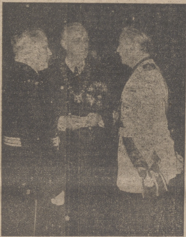
La entrevista Von Ribbentrop-Serrano Suñer.

Durante su estancia en Bruselas, el embajador extraordinario del Caudillo fué cumplimentado por todas las autoridades, de las