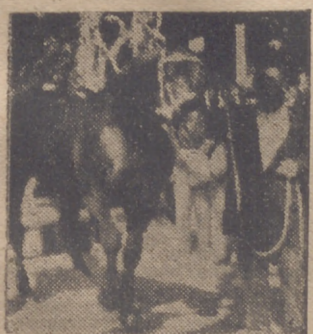
El caballo semontal, «Kaiser», ganador del primer premio de ganado caballar

A la consecución de este fin deben ser encaminadas todas iniciativas de los organismos organizadores del I Concurso Provincial de Ganados, que, con el apoyo de las autoridades, pueden hacer realidad la aspiración de una Feria Regional de Productos Castellanos, exponente de la riqueza e importancia de este trozo de España.